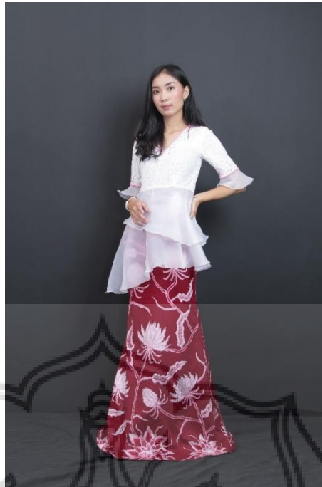
Gambar 50. Busana Karya 3 (pada Rabu 1 Januari 2020)