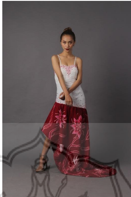
Gambar 51. Busana Karya 4 (Fotografer: Roby, pada Rabu 2 Januari 2020)