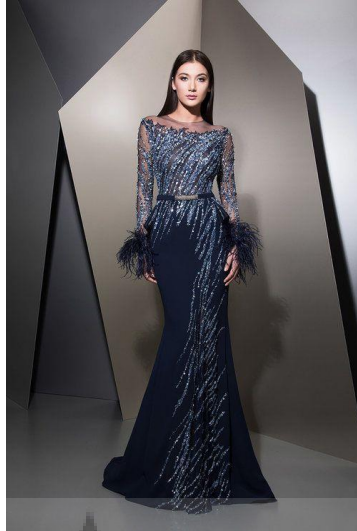
Gambar 3. Busana Evening