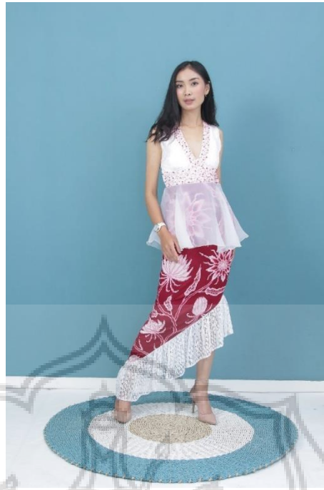
Gambar 49. Busana Karya 2 (Fotografer: Leo, pada Rabu 1 Januari 2020)