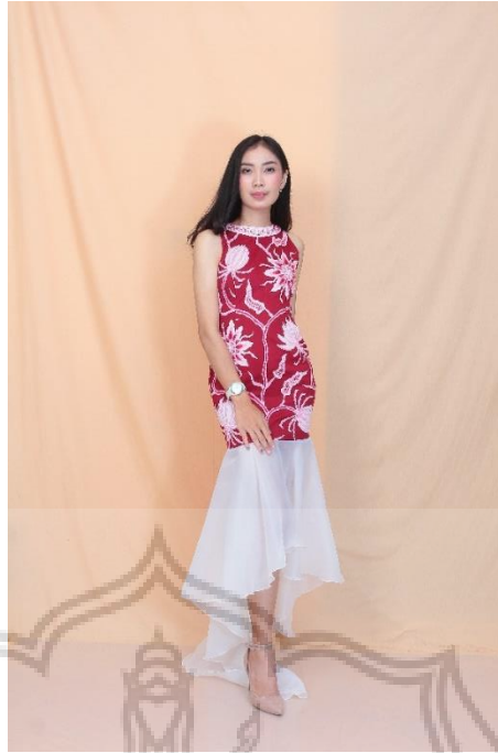
Gambar 48. Busana Karya 1 (Fotografer: Leo, pada Rabu 1 Januari 2020)