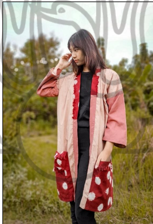
Gb 4. Foto Busana 4