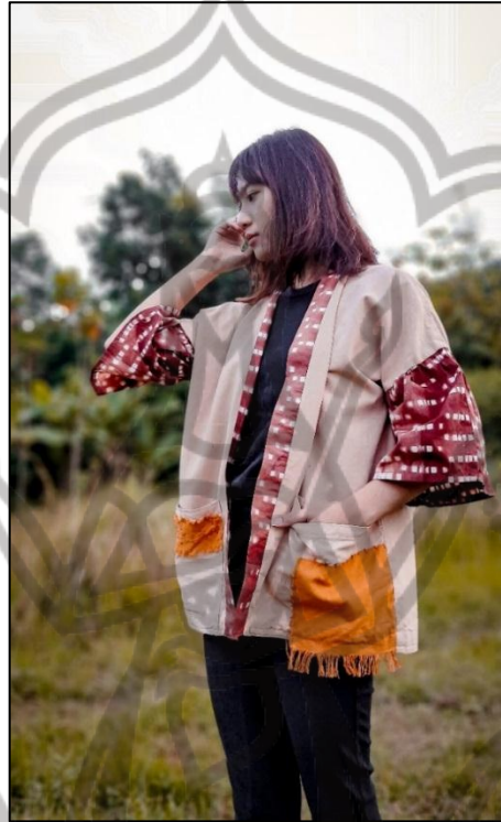
Gb 1. Foto Busana 1

Judul : Tsuchi Tahun Pembuatan : 2021 Ukuran : All size Teknik : Shibori dan Sulam