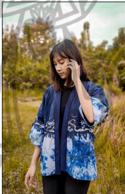
Gb 2. Foto Busana 2

Judul : Mizu Tahun Pembuatan : 2021 Ukuran : All size Teknik : Shibori dan Sulam