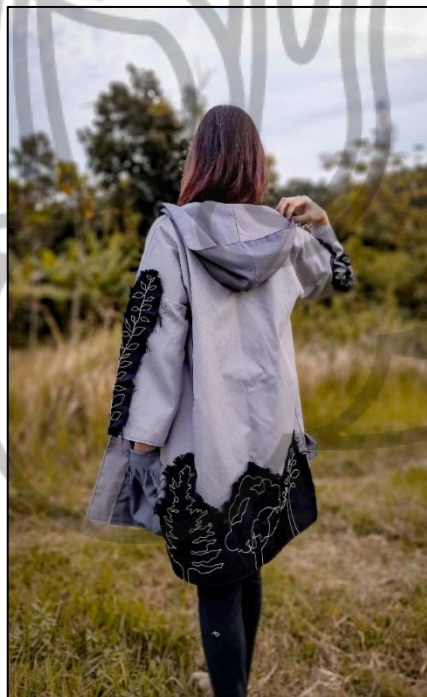
Gb 3. Foto Busana 3