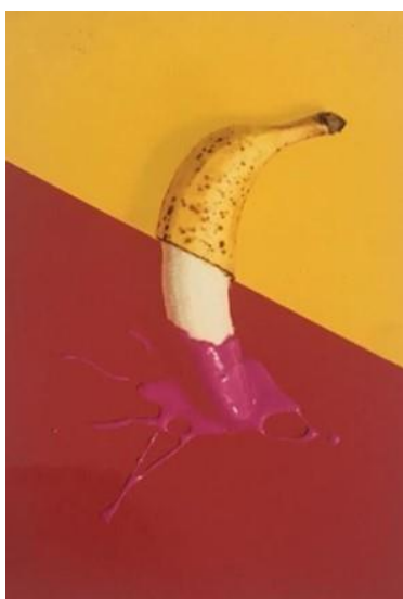
Gambar 5. “Nekad”

Manusia (Puspita, 2020), dalam karyanya ini Maria Paragita merempresentasikan sampah plastik yang menjadi pencemaran lingkungan terhadap perasaan hewan-hewan yang mati dan terluka karena dampak sampah plastik.