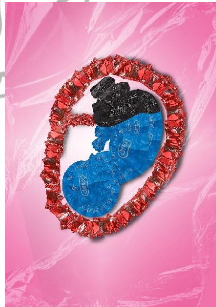
Karya 2 Dilema 2021 40 x 60 cm Digital print on luster paper

bentuk bumi yang makin dipenuhi oleh eksistensi sampah terutama kantong plastik sampah yang sekali pakai ini adalah kantong pembungkus yang sering digunakan memuat dan membawa barang konsumsi oleh masyarakat. Sebagian besar objek yang digunakan adalah kantong plastik dan penambahan objek tangkai globe atau bola dunia. Pemilihan warna kantong plastik warna biru dan hijau dipilih untuk menyimbolkan lautan dan dataran yang tercemar sampah kantong plastik dari dampak gaya hidup masyarakat yang menggunakan kantong plastik sekali pakai.