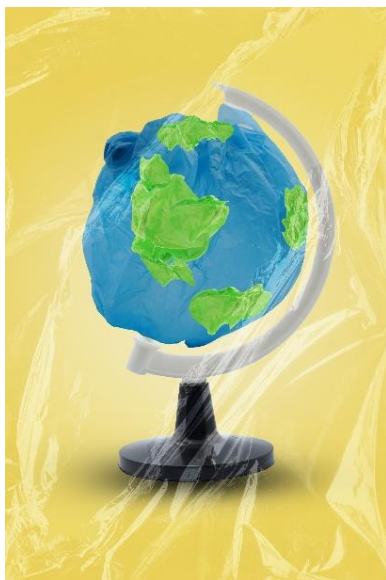
Karya 1 Trash Globe 2021 40 x 60 cm Digital print on luster paper

dari representasi yang dibuat oleh pencipta karya fotografi. Berikut ini yang merupakan dari hasil karya penciptaan fotografi beserta pembahasannya.