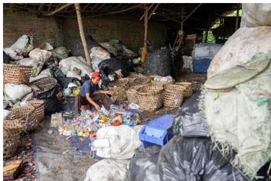
Gambar 2. Kondisi sampah yang menumpuk di TPA Piyungan sumber: dokumentasi pribadi

TPA Piyungan mencapai 630-650 ton per hari.