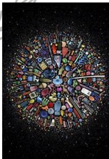
Gambar 6. “Lost at Sea”

budaya. Dengan ide dan konsep yang baik buah dan sayur bisa menyampaikan pesan dan memberikan nilai estetis dan makna baru pada sebuah karya seni. Ide karya ini muncul dari keresahan pribadi mengenai kurangnya perhatian masyarakat dalam menghadapi masalah sosial terhadap gaya hidup, maka dari itu tugas akhir ini bertujuan untuk menyampaikan kritik sosial terhadap masalah-masalah gaya hidup khususnya dalam aspek seperti konsumerisme, globalisasi dan semacamnya tetapi menggunakan objek yang berbeda yaitu dengan sampah plastik.