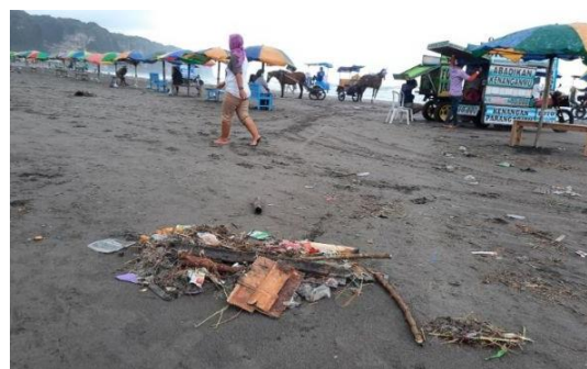
Gambar 3. Kondisi sampah di Pantai Parangtritis Yogyakarta

Di daerah tempat tinggal dalam satu gang saja sudah terdapat dua pengepul plastik yang jaraknya tidak jauh dari tempat tinggal. Bukan hanya itu saja masih banyak lagi pengepul plastik lainnya yang menjamur dan tidak dapat disebutkan satu persatu. Hal tersebut mencerminkan bahwa penggunaan plastik saat ini sangat diminati oleh masyarakat, terutama botol plastik dan kemasan plastik sekali pakai secara berlebihan yang akhirnya dibuang dan menjadi sampah. Apalagi saat ini botol plastik dan kemasan makanan dapat diperoleh dengan mudah.