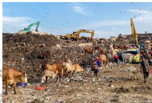
Gambar 1. Kondisi sampah yang menumpuk di TPA Piyungan

panas, lebih ringan dan praktis dibandingkan peralatan berbahan logam dan batu. Plastik membantu membuat berbagai macam produk yang berguna, tahan lama, dan serbaguna.