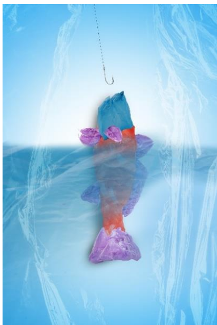
Karya 5, Berubah 2021 30 x 45 cm Digital print on luster paper

Pada karya ini (karya 5) menggambarkan suatu bentuk ikan yang terbentuk dari susunan banyaknya kantong plastik yang pada umumnya digunakan memvisualkan dari tumpukan sampah plastik yaitu kantong plastik sekali pakai yang biasanya digunakan setiap masyarakat dalam kehidupan sehari-hari untuk adalah kantong pembungkus yang sering digunakan memuat dan membawa barang konsumsi oleh masyarakat atau elemen pendukung untuk mempertegas konsep penggambaran visual guna membentuk sebuah imaji