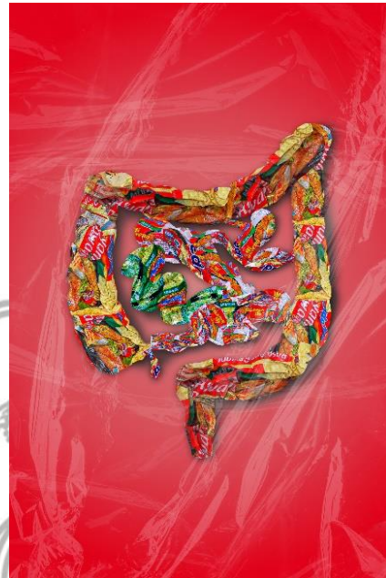
Karya 3 Usus 2021 30 x 45 cm Digital print on luster paper

seks pada remaja adalah banyaknya mitos yang dipercaya, sehingga terbawa sampai dewasa.