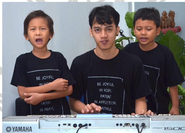
4. Keyboard Gereja dengan kedua Jemaat muda saat berlatih pujian sebelum siaran langsung untuk kebaktian umum.