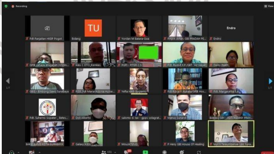
2. Peserta atau jemaat gereja JAGI dalam proses pujian dan penyembahan melalui zoom meeting