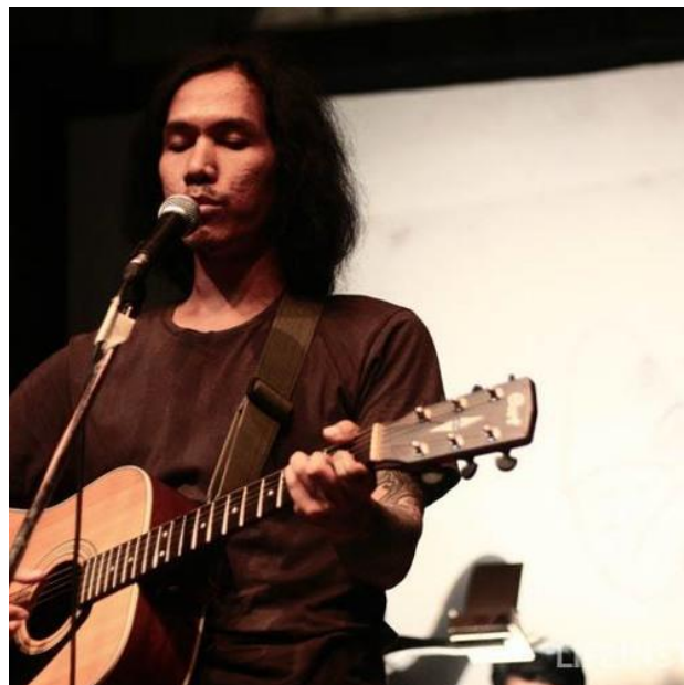
Penampilan Sisir Tanah pada acara LELAGU#10: MENDUA, Kedai Kebun Forum