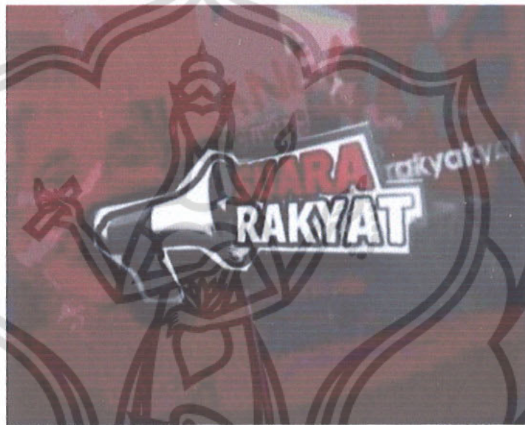
Gambar 4. Suara Rakyat.

konflik sosial, penggusuran, dan permasalahan antara masyarakat dengan pemerintah. Program Suara Rakyat memberikan informasi yang berimbang yang disampaikan dari nara sumber, baik yang saling mendukung maupun yang berbeda pendapat/ pandangan. Seperti slogan dari program Suara Rakyat “Tidak hanya Pemerintah saja yang bersuara. Rakyat pun berhak bersuara untuk mengemukakan pendapatnya. Bahwa program Suara Rakyat memang ditujukan untuk menyuarakan fenomena – fenomena sosial yang semakin sering terjadi, terutama pada kalangan masyarakat kelas bawah.