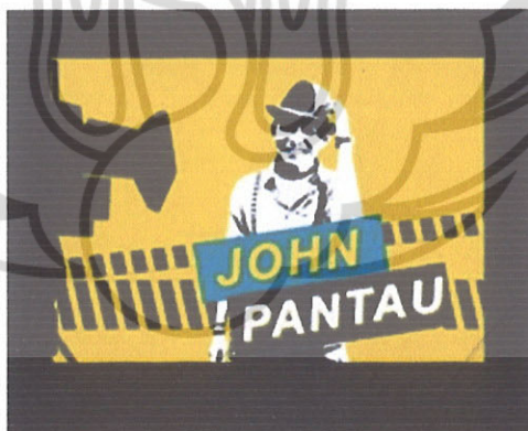
Gambar 3. Opening acara John Pantau

Program ini adalah reality show, dengan pembawa acara yang kocak dan jail. Mungkin inilah yang menjadi keunikan reality show ini. John Pantau ditayangkan stasiun Trans TV, setiap minggu jam 16.00 WIB. Dengan durasi 30 menit, Program ini juga menyoroti masalah – masalah sosial sebagai tema utamanya. Dengan tagline ‘jaga perilaku biar gak malu, tayangan ini mengemas kelucuan, aksi John Pantau yang juga merupakan nama host dalam acara ini, menyadarkan warga dari tindakan atau perilaku yang melanggar. Tayangan ini tidak hanya sekedar menghibur, tapi juga ada transfer nilai positif untuk memperbaiki perilaku masyarakat dan mampu membuat penontonnya memahami akibat dari pelanggaran yang dilakukan serta modus-modus lain yang merugikan orang lain. Memberikan informasi dengan jelas sebuah pelanggaran di masyarakat yang tidak terlalu berat, simpel dan terkadang menjadi dosa umum., dengan membahas pelanggaran yang seringkali dianggap remeh oleh sebagian masyarakat. Aksi John Pantau mampu membuat pelakunya jera dan merasa malu terhadap kesalahan yang dilakukannya.