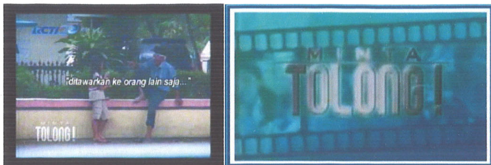
Gambar 1. Salah satu adegan dalam acara Minta Tolong