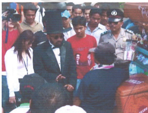
Gambar 2. Pembawa acara Uang Kaget berinteraksi langsung dengan masyarakat. (www.rcti.tv)

Program Uang Kaget juga merupakan reality show , ditayangkan oleh stasiun televisi RCTI. Seperti halnya program Tolong, program Uang Kaget juga mengambil masalah ekonomi sebagai temanya. Dalam program Uang Kaget ini, Seseorang yang telah dipilih sebagai tallent akan diberikan sejumlah uang yang boleh digunakan ataupun dibelanjakan untuk kebutuhan-kebutuhan yang prinsipil. Tallent harus menghabiskan semua uang yang diberikan sesuai dengan batas waktu yang telah ditentukan. Jika uang yang diberikan masih ada yang tersisa, maka sisa uang itu akan diambil kembali oleh pembawa acara. Yang menarik dari program uang kaget ini adalah ketika tallent kebingungan memilih prioritas barang yang akan dibeli, apalagi harga satu barang yang akan dibeli tidak boleh melebihi harga yang telah disyaratkan oleh pembawa acara.