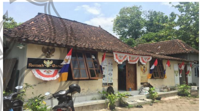
Gambar 1 : Museum Rumah Garuda tampak depan (Foto : Hairul Anwar, 10 November 2021)

disebut “museum” sebab telah terbukti sebagai wadah pameran dan karnaval museum. Alamat museum Rumah Garuda bertempat di Bantul, area sawah, Dusun Trirenggo, Yogyakarta. Sejak tahun 2003 telah banyak mengoleksi benda visual tentang Garuda, ada juga berupa buku atau apapun yang berkaitan dengan Garuda yang kemudian Nanang jadikan bahan tersebut guna melanjutkan pendidikannya.