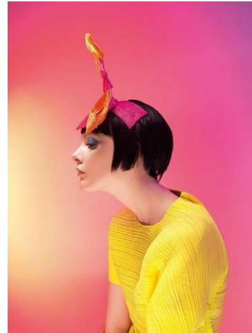
Gambar 3 “KNACK “

Karya Julia Johnson digunakan sebagai tinjauan karya karena pemilihan arah cahaya yang tepat dapat menonjolkan detail dan warna busana yang dikenakan, selain itu pemilihan pose yang sederhana membuat produk busana yang dikenakan menjadi tertuju pada mata audience .