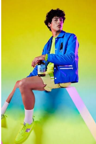
Gambar 2 “Health Ade Summer 2019 Campaign “

Karya Julia Johnson digunakan sebagai tinjauan karya karena pemilihan arah cahaya yang tepat dapat menonjolkan detail dan warna busana yang dikenakan, selain itu pemilihan pose yang sederhana membuat produk busana yang dikenakan menjadi tertuju pada mata audience .