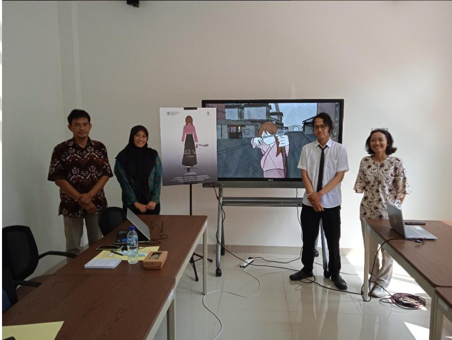
Gambar 62 & 63. Suasana Sidang dan foto bersama dengan para penguji