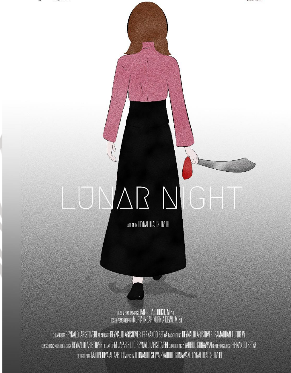
Gambar 64. Poster