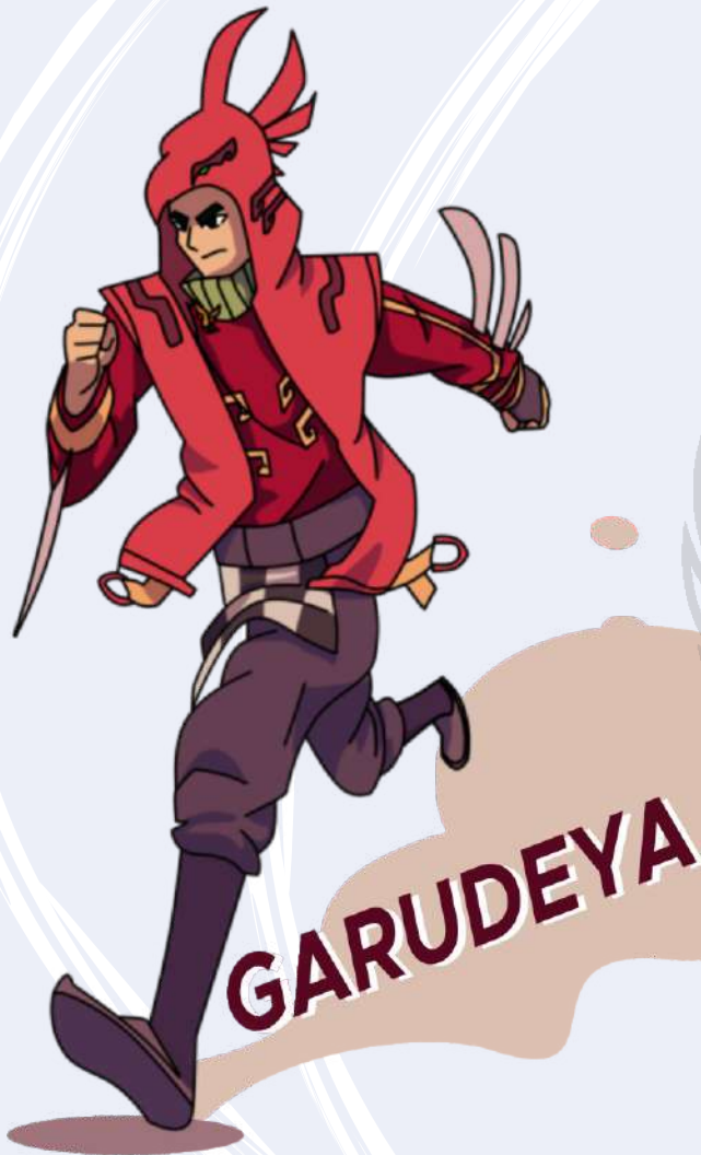
4.2 Gambar Contoh Merchandise oleh Audrey NFF