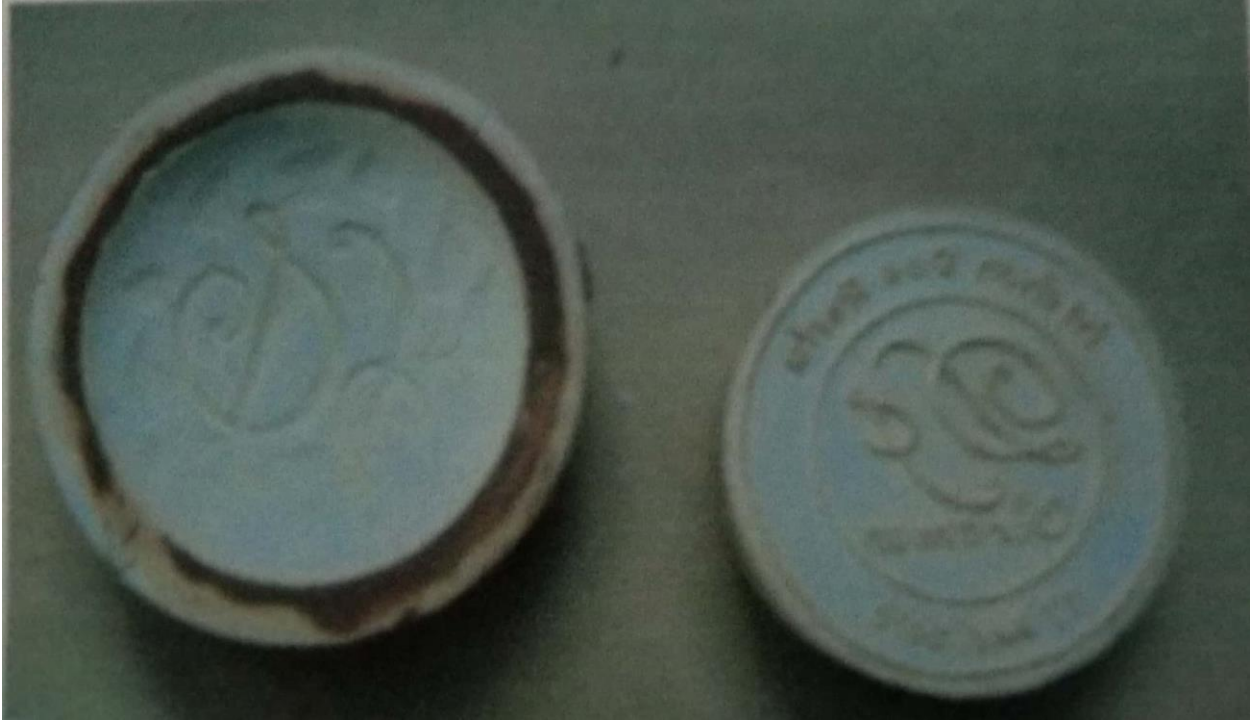
Cetakan dari Gips