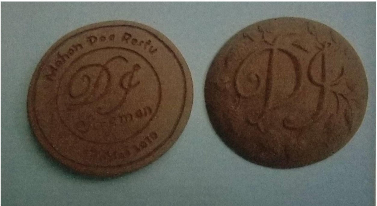
Hasil dari Cetakan