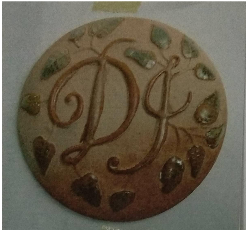
Kreweng dari Keramik

Uraian Ciptaan : Souvenir Kreweng adalah salah satu properti dalam acara Perkawinan bagian : Jualan dawet , ini biasanya diselenggarakan oleh pihak pengantin putri yang dihadiri oleh pihak pengantin laki-laki ,kerabat, dan para tetangga. Tradisi jualan dawet bagi masyarakat Jawa dalam hajatan pengantin memerlukan kreweng: yaitu uang untuk membeli dawet. Dibuat dari keramik bakaran bisquit atau terakota, berbentuk uang kepeng dalam ukuran besar . Bagian muka terdapat logo atau inisial pengantin, bagian belakang ada tulisan tanggal penyelenggaraan . Dalam desain ini ada logo D dan I adalah inisial pengantin. Berwarna coklat natural dan bagian tulisan dilapisi glasir.