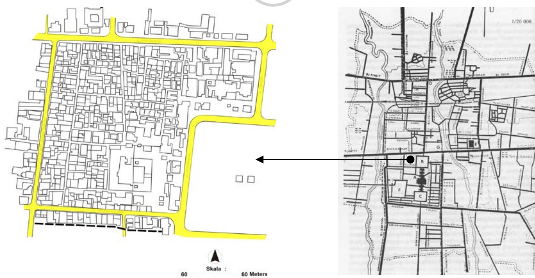
Gambar 1 Peta Permukiman Kauman dan lokasinya di pusat kota Yogyakarta

Peristiwa lain yang menarik di kampung Kauman Yogyakarta adalah lahirnya Muhammadiyah, sebuah organisasi yang melancarkan pembaharuan-pembaharuan pada semua aspek keagamaan baik syariat (hukum) dan muamalah (praktek) pada kehidupan masyarakat sehari-hari. Reformasi yang menyeluruh ini tidak ayal lagi juga mempengaruhi bidang kebudayaan pada masyarakat di kampung Kauman. Sebelum lahirnya Muhammadiyah Islam yang dipraktekkan di sini adalah Islam tradisional yang mempraktekkan taqlid , bid'ah , dan khurafat . Akan tetapi Muhammadiyah, yang dipelopori Kyai Dahlan, berusaha menghapuskan praktek-praktek tersebut dan menganjurkan Islam yang murni sesuai dengan tuntunan Al-Qur'an dan Al-Hadits. Gerakan Muhammadiyah sering disebut sebagai gerakan pemurnian Islam yang modern yang dibedakan dengan gerakan Islam tradisional yang biasanya dikaitkan dengan Nahdatul Ulama (NU).