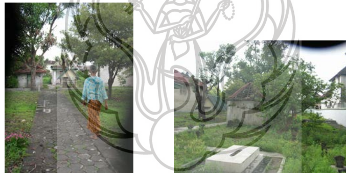
Gambar no. 2 Suasana makam di belakang Masjid Gede Kauman Yogyakarta, sepi tanpa kegiatan.

Makam tanpa kegiatan merupakan contoh yang paling tepat untuk menggambarkan penerapan tauhid Islam dalam menata ruang di permukiman Kauman Yogyakarta. Dalam arsitektur tradisional Jawa makam dan masjid adalah dua ruang yang selalu berdekatan, ada masjid kemudian diikuti dengan makam atau ada makam dahulu kemudian diikuti dengan Masjid. Sebagai bangunan peninggalan masa lalu maka Masjid Gede Kauman Yogyakarta juga dilengkapi dengan makam. Dahulu makam di sini dipergunakan untuk menguburkan para kerabat Sultan, terdapat di dalamnya kubur garwa ampilan Hamengku Buwana I dan II beserta putranya, makam ini juga dipakai untuk menguburkan para sahid (korban) perang yaitu perang Diponegoro dan perang Kemerdekaan. Sejak tahun 1950-an makam Kauman ini sudah ditutup sebagai tempat pemakaman, saat ini walaupun terdapat abdi dalem juru kunci namun makam dirawat seadanya dan tidak nampak ada kegiatan di dalamnya.