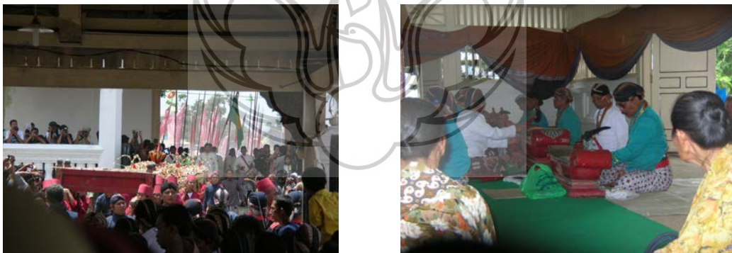
Gambar no. 6 Gunungan pada Grebeg Maulud serta suasana di Pagongan mendengarkan gamelan Sekaten.

kegiatan dalam upacara ini yang tidak disetujui oleh kebanyakan warga Kauman, seperti minta berkah kepada gamelan, kepercayaan bahwa makanan dari gunung mengandung kekuatan gaib, namun demikian dua upacara tersebut masih tetap dapat dilangsungkan di tempat ini. Bagi warga Kauman upacara-upacara tersebut diterima sebagai kegiatan budaya dari rakyat Kasultanan Yogyakarta, dan apabila masih terdapat kegiatan-kegiatan yang menyimpang dari ajaran Islam yang benar, maka mereka menganggap hal ini sebagai kewajiban dakwah yang masih harus dilanjutkan. Penerimaan ini merupakan salah satu wujud dari pengembangan ukhuwah , membangun persaudaraan, menjaga kerukunan agar dapat hidup guyub dengan saudara seimannya. Pada fenomena ini terjadi desakralisasi ruang Sekaten dan Gerebeg. Walaupun bagi kebanyakan masyarakat Kasultanan Yogyakarta kedua ruang tersebut masih diyakini mempunyai kekuatan yang memberkahi, namun bagi warga Kauman pada masa sekarang ruang Sekaten dan Gerebeg adalah ruang-ruang yang tidak lagi mempunyai kesakralan, ruang tersebut hanya merupakan ruang kegiatan budaya biasa, dan demi menjaga ukhuwah ruang Sekaten dan Gerebeg masih dijaga keberlangsungannya oleh warga Kauman.