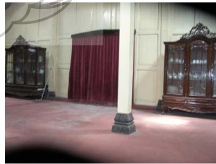
Gambar no. 5 Ndalem Pengulon tampak dari luar dan interior ndalem yang sepi

Secara keruangan nilai egaliter juga dapat dibaca pada fenomena perubahan nama area RW XI, dari Ngindungan menjadi Kauman Wetan. Apabila dilihat pada area Ngindungan maka ada beberapa fakta empiris yang perlu disampaikan yaitu pejabat tradisional yang menempati area ini disebut sebagai Lurah seperti Lurah Humam, Lurah Walil, Lurah Ghozali, demikian pula area ini tidak diperuntukkan bagi