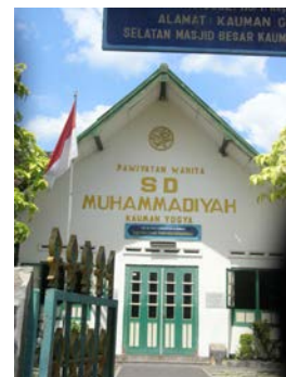
Gambar no. 4 Dua sekolah klasikal, TK ABA dan SD Muhammadiyah Kauman.