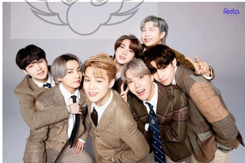
Gambar 1 Member BTS (Suga, Jungkook, Jimin, Jin, J-hope, RM, V) (kiri ke kanan)

Pada 2017 BTS melakukan re-branding arti nama mereka menjadi Beyond The Scene untuk keperluan promosi di Amerika. BTS yang beranggotakan dengan nama panggung RM (Kim Namjoon) sebagai leader , Jin (Kim Seok Jin), Suga (Min Yoongi), J-Hope (Jung Hoseok), Jimin (Park Jimin), V (Kim Taehyung) dan Jungkook (Jeon Jungkook) merupakan laki-laki yang mempunyai mimpi yang sama mengubah stigma musik Korea yang hanya menyanyikan lagu yang romantis-romantis. Mereka mengubah stigma tersebut dengan menghadirkan lagu-lagu dari keresahan mereka tentang isu remaja, politik, serta semangat remaja. Lagu-lagu mereka dapat dinikmati tidak hanya untuk orang Korea, tetapi juga oleh semua kalangan.