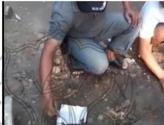
Warga saat menggali tanah di kuburan dan menemukan bungkusan kertas yang dipendam.