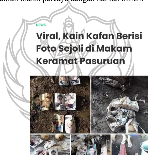
Gambar 1.2 : Penemuan foto Sejoli di Makam Sumber ( www.madiunpos.com )

Pada masyarakat Pasuruan yang notabennya adalah para alumnus pondok pesantren, memiliki pola pikir budaya mistik yang kental. Sehingga pola pikir yang demikian memberikan warna tersendiri dalam kehidupan masyarakatnya. Pengaplikasian budaya mistik dalam kehidupan di masyarakat Pasuruan menjadi sebuah awal munculnya pemikiran mengenai uniknya masyarakat modern di Indonesia yang dikelilingi dengan berbagai temuan teknologi serta pola pikir yang begitu futuristik namun masih percaya dengan hal hal mistis.