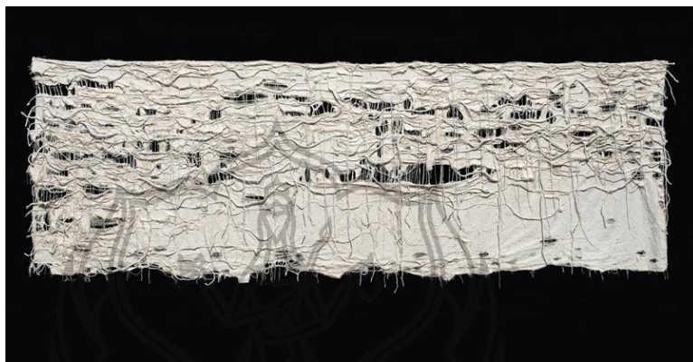
Gambar 1.3 Karya Gatot Pujiarto Strength in Fragility Fragility 2015

oleh penulis. Hal ini dilakukan tentu sebagai upaya dalam memunculkan suatu pembeda, sehingga dapat menjadi orisinalitas dari karya yang diciptakan. Dengan menggali informasi mengenai referensi seniman dan karyanya, akan memberikan pencerahan mengenai apa yang dapat dikembangkan dari karya yang sudah diciptakan oleh seniman referensi dan juga apa yang belum diciptakan, sehingga dengan demikian perbedaan dari segi material, ide, dan gagasan serta bentuk dapat ditemukan.