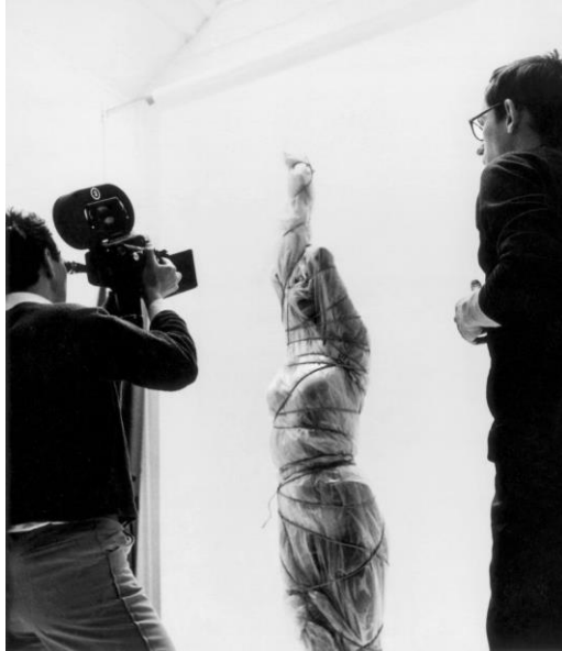
Gambar 1.4 Karya Crhisto Wrapped Women and Fashion Design 1960

Penyajian karya yang akan dipresentasikan oleh penulis dengan penggunaan materi dan pendekatan zimat merupakan sebuah proyeksi kerja kreatif dengan makna, bahwa zimat merupakan salah satu bentuk kebudayaan mistik Jawa yang masih dapat ditemui dalam kehidupan modern saat ini.