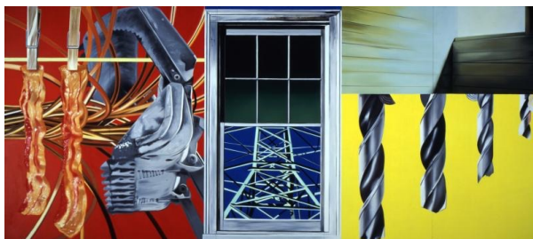
Gambar 4 Karya James Rosenquist "Industrial Conttage", Oil on Canvas, 1977

James Rosenquist adalah seniman Amerika dan salah satu pendukung gerakan seni populer. Digambar di atas dasar lukisan simbolik, Karya-karya milik