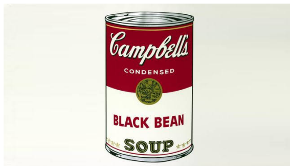
Gambar 1 Karya Andy Warhol "Campbell's Soup Cans" (Sumber: www.pasarkreasi.com )

Karya seni Andy Warhol yang paling dikenal adalah lukisan-lukisan cetakan sablon, seperti kemasan produk konsumen dan benda sehari-hari yang sangat sederhana. Seperti pada gambar di atas karya kemasan Campbell's Soup Cans , Adalah awal mula lahirnya Pop Art, sebuah teknik penggabungan seni komersil dan seni populer. Alasan terlahirnya lukisan inipun bisa dibilang sangat sederhana, karena sang pelaku Andy Warhol selalu memakannya setiap hari sehingga ia memilih kaleng sup itu menjadi objek lukisannya. Dari alasan sederhana itu bisa menjadikan sebuah kaleng sup yang biasanya orang buang