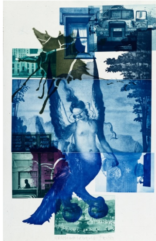
Gambar 3 Karya Robert Rauschenberg, Intaglio printed in color ink on arches wove paper, 1975

Robert Rauschenberg adalah salah satu pelopor dalam perkembangan seni pop pada 1960-an, seniman terkenal Robert Rauschenberg dikenal karena inovasi artistiknya dan penggunaan metode yang tidak konvensional dalam penciptaan karya seni. Dia adalah seorang pelukis, seniman grafis, dan pematung yang terkenal karena "menggabungkan" yang merupakan kombinasi dari kedua lukisan dan patung. Dia dikreditkan dengan menciptakan istilah ini untuk menggambarkan kreasi sendiri yang terdiri dari lukisan yang melekat pada barang sehari-hari normal seperti foto, pakaian, dan objek tiga dimensi lainnya. Dia mencoba menyatukan seni dan kehidupan sehari-hari melalui perpaduannya. Robert Rauschenberg diingat karena mengantarkan gerakan artis pop tahun 1960-an. Dia menggabungkan bentuk seni baru, "menggabungkan" yang mencakup barang sehari-hari yang tidak