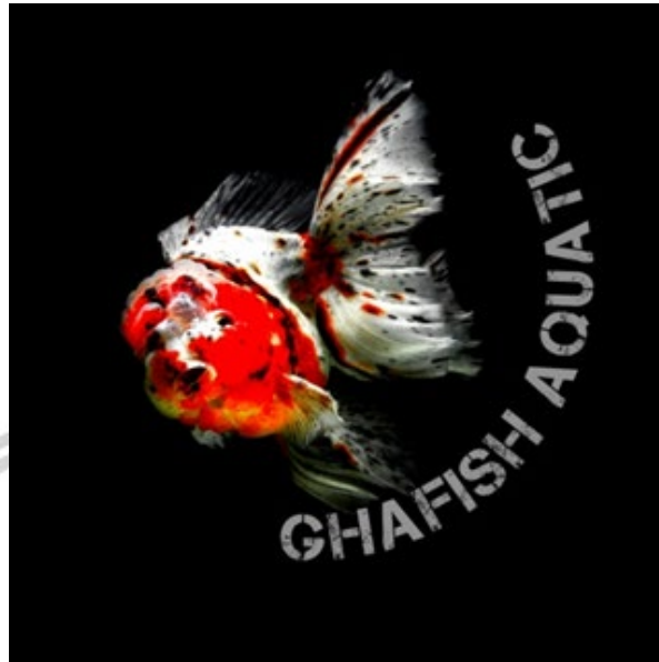
Gambar 1 Logo dari Ghafish Aquatic

Penciptaan karya tugas akhir ini berawal dari pemotretan hewan yang berada di darat. Sebelum melakukan pemotretan, biasanya melihat referensi foto hewan-hewan dahulu di akun media sosial yang memuat foto-foto berbagai jenis hewan. Selama mengamati dan mencari referensi, ternyata banyak foto hewan, akan tetapi hewan yang dipotret kebanyakan adalah hewan darat. Berdasarkan hal tersebut, timbul ide untuk membuat sebuah karya visual hewan yang ada didalam air terutama hewan ikan mas koki.