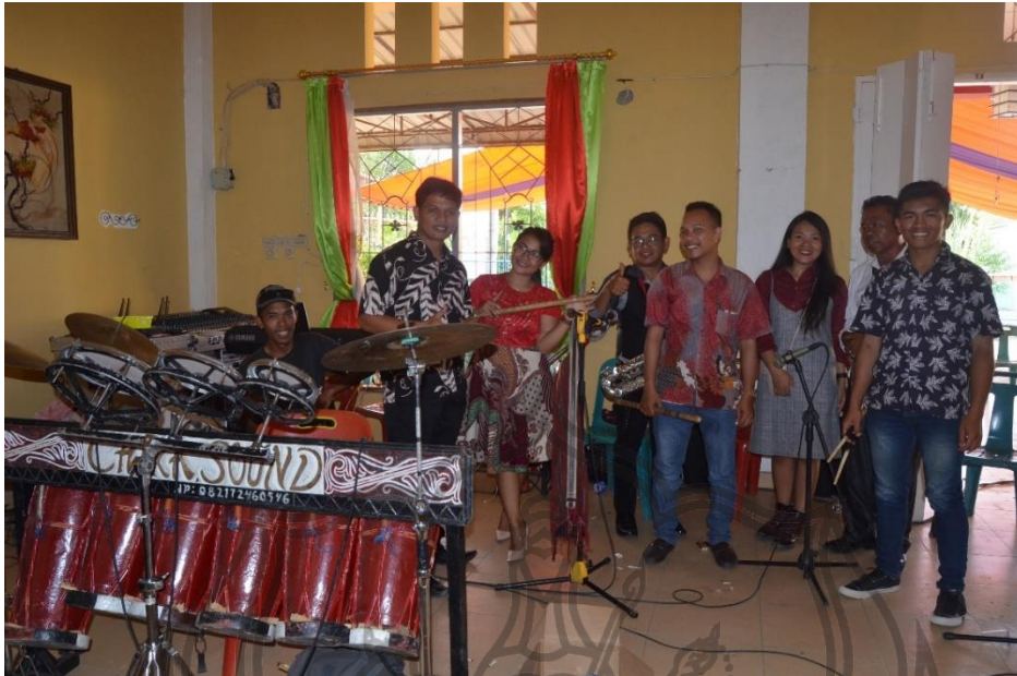
Gambar 17. Foto bersama Pemain Sulkibta (Foto: Putra Harianja, 23 Maret 2019)