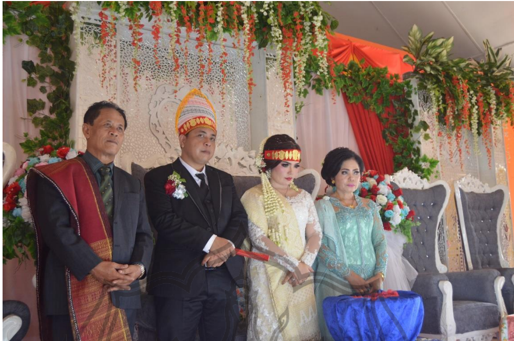
Gambar 19. Foto kedua mempelai bersama orangtua laki-laki (Foto: Desi Sirait, 23 Maret 2019)