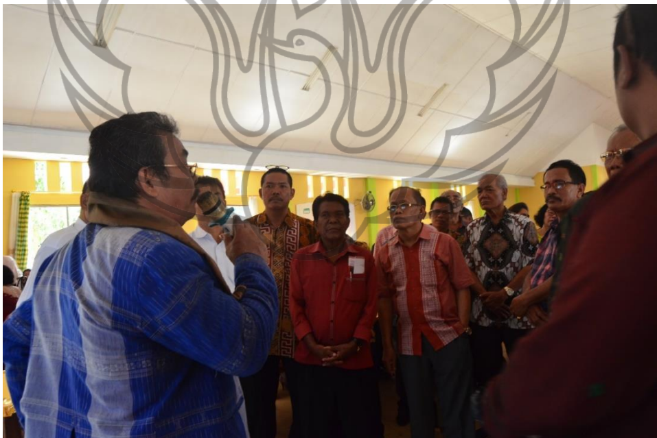
Gambar 18. Foto Parhata bersama kelompok marga pihak laki-laki (Foto: Desi Sirait, 23 Maret 2019)