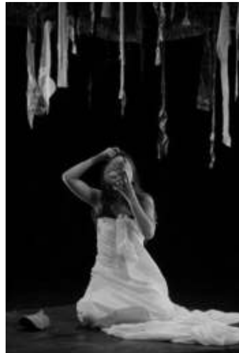
Gambar 8: Penari Mimpi di Atas Impian saat tampil tanpa lembaran kain (gambar kiri) dan saat bagian ending tubuhnya dibalut kain putih, mengenakan topeng dan masker (foto: Ody, Agustus 2020)