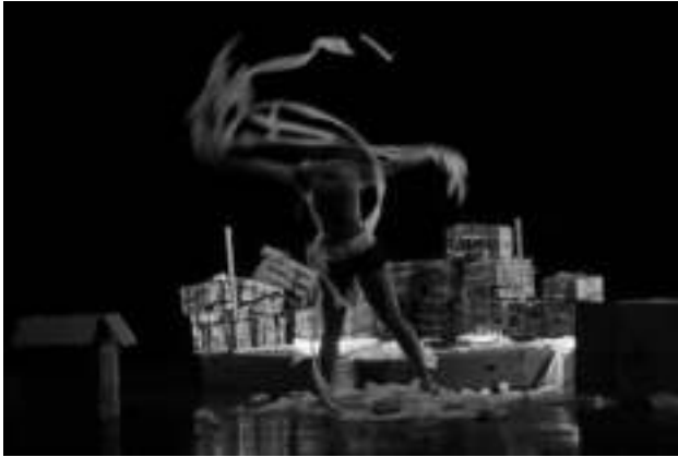
Gambar 6: Penari Kotak Waktu menggerakkan tisu yang di tubuhnya menciptakan disain tertunda (Agustus 2020)