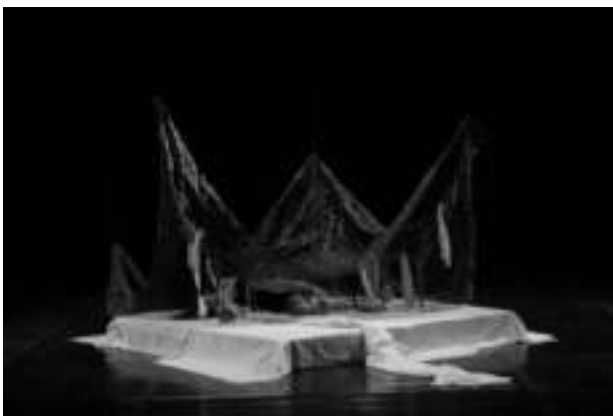
Gambar 2: Eksekusi tata rupa pentas, simbol kamar wanita pada koreografi Mimpi Di atas Impian

Trap kayu ukuran 240 cm x 240 cm tinggi 20cm Kain lembaran berbahan lembut warna putih Paranet, ayaman tali raffia warna hitam yang biasa digunakan untuk peneduh tanaman.