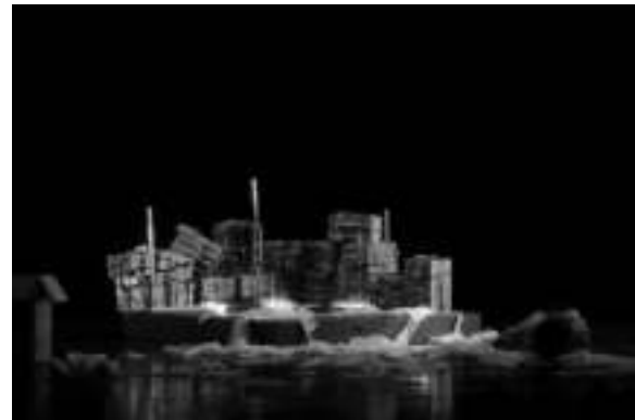
Gambar 4: Eksekusi tata rupa pentas, simbol keterbatasan ruang pada Kotak Waktu (foto: Ody, Agustus 2020)

Trap kayu ukuran 240 cm x 240 cm tinggi 20n cm Tumpukan kardus bekas berbagai ukuran