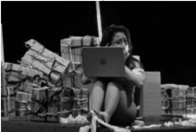
Gambar 7: Penari Kotak Waktu mengenakan masker dan memegang laptop (foto: Ody, Agustus 2020)