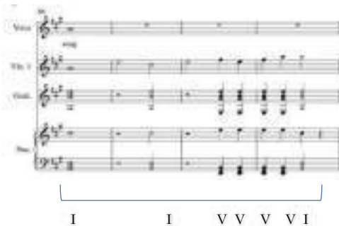
Notasi 11. Birama 66 – 69 Coda

Pada birama 43 – 51 menggunakan akor I dan V. Terdapat melodi tanggana yang diselaraskan dengan akor-akor.