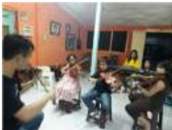
Mahasiswa Sedang Melatih Instrument Biola