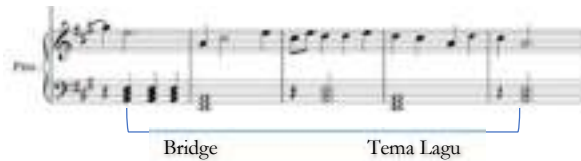
Notasi 9. Birama 38 – 42

Akor yang digunakan masih sama yaitu EM - AM - EM - AM (V I V I) dan birama terakhir hanya terdapat dua nada yaitu nada D dan A yang dibunyikan bersamaan. (Anglade et al., 2009)