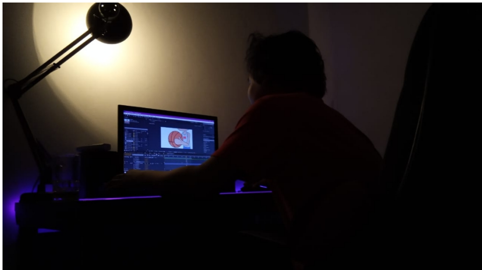
Gambar Proses compositing & editing