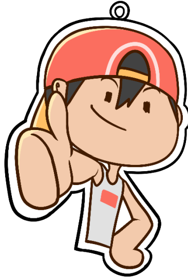
Gambar Merchandise gantungan kunci Muklis