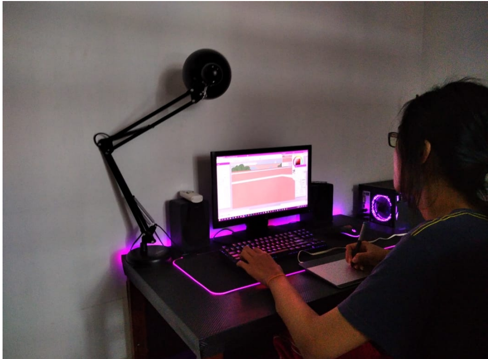
Gambar Proses pembuatan background