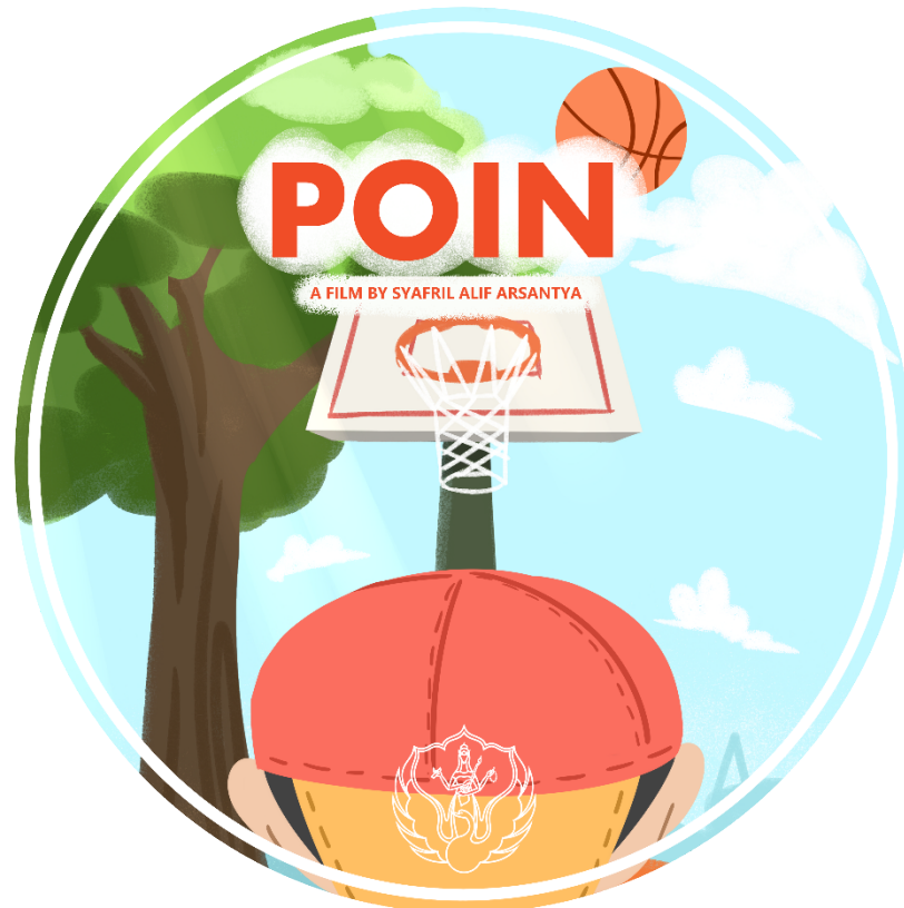
Gambar Cover DVD Animasi POIN