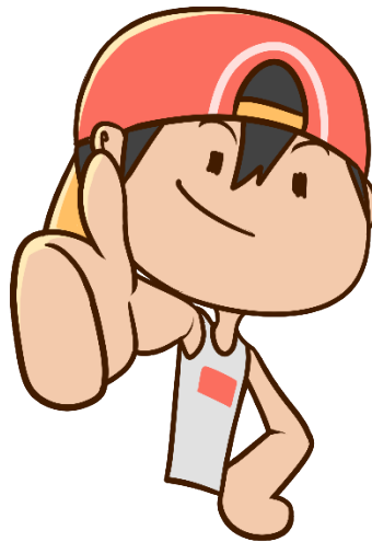
Gambar Merchandise sticker Muklis