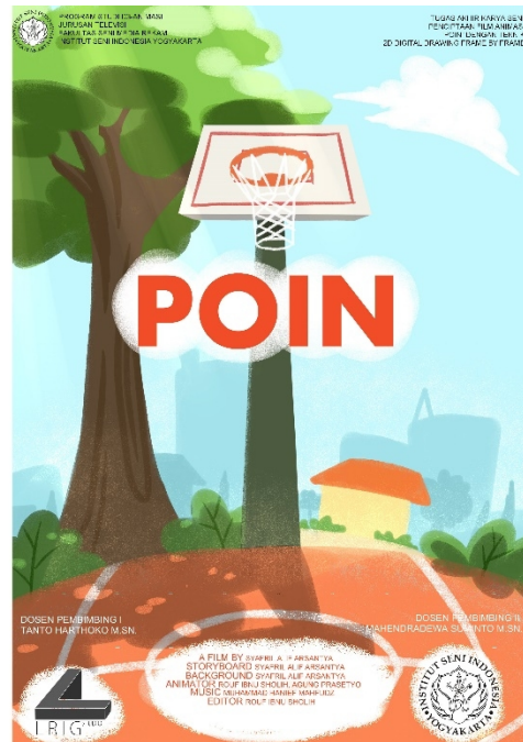
Gambar Cover Case DVD Animasi POIN