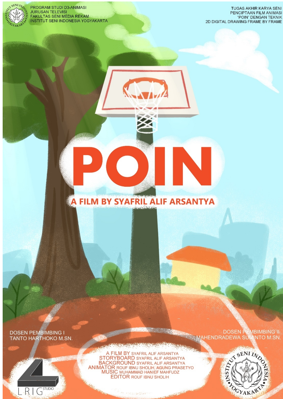
Gambar Poster Animasi POIN