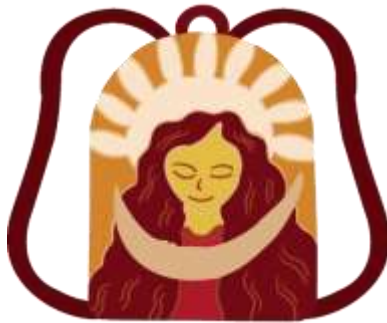
Gambar 7. Desain Terpilih Karya 1