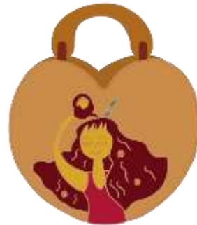
Gambar 8. Desain Terpilih karya 2