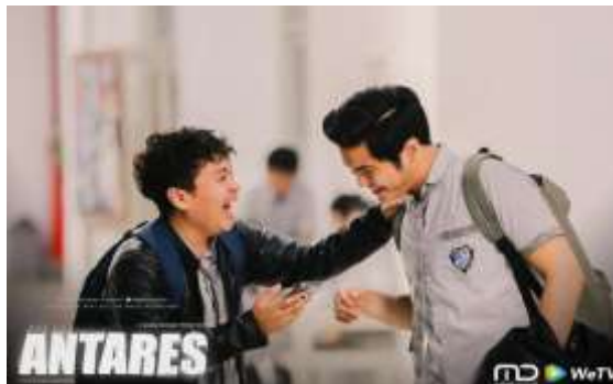
Gambar 4. Ekspresi Berdamai Dengan Lingkungan Sekitar Untuk Menjadi Pribadi Yang Lebih Baik

Gambar 1. Ekspresi Depresi Ketika Sedang Menghadapi Suatu Masalah. Gambar 2. Ekspresi Mendengarkan Musik Dengan Merenung. Gambar 3. Ekspresi Berdamai Dengan Diri Sendiri Yang Menjadi Lebih Kuat. Gambar 4. Ekspresi Berdamai Dengan Lingkungan Sekitar Untuk Menjadi Pribadi Yang Lebih Baik