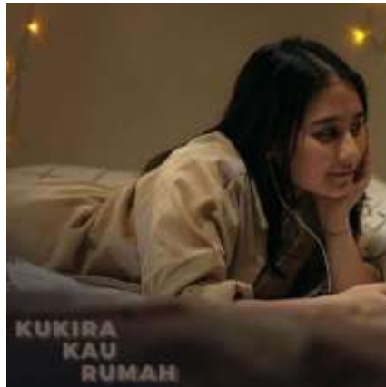
Gambar 2. Ekspresi Mendengarkan Musik Dengan Merenung