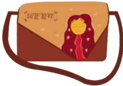
Gambar 5. Desain Terpilih Karya 1