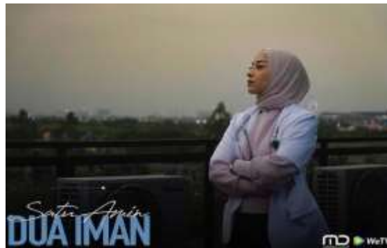
Gambar 3. Ekspresi Berdamai Dengan Diri Sendiri Yang Menjadi Lebih Kuat