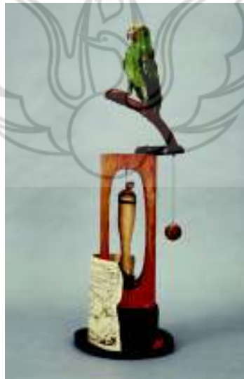
Joan Miró Object , 1936

https://fbcdn-sphotos-c-a.akamaihd.net/hphotos-ak-prn1/t1.0-9/p552x414/934623_565783796776705_537148536_n.jpg