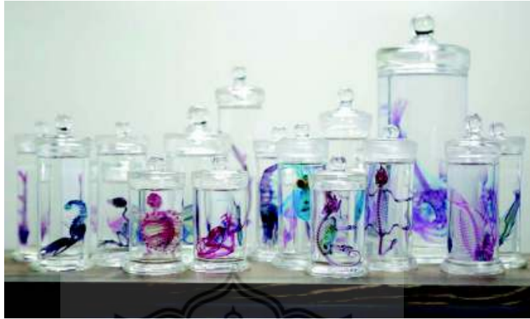
Corallus Caninus, Alchemy Project , Mixed Media, 2013

https://scontent-b-sin.xx.fbcdn.net/hphotos-frc3/t31.0-8/p843x403/10011968_688848387822980_1596974499_o.jpg