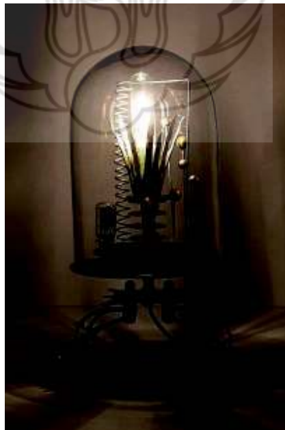
Steampunk Tendencies, Antrophology lamp , mixed media, 2013

https://scontent-b-sin.xx.fbcdn.net/hphotos-frc3/t31.0-8/p843x403/10011968_688848387822980_1596974499_o.jpg