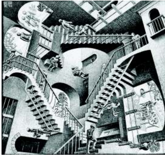
M. C. Escher, Renalitivity, 1953

https://fbcdn-sphotos-c-a.akamaihd.net/hphotos-ak-prn1/t1.0-9/p552x414/934623_565783796776705_537148536_n.jpg