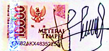
Rahul Alfredo Siboro