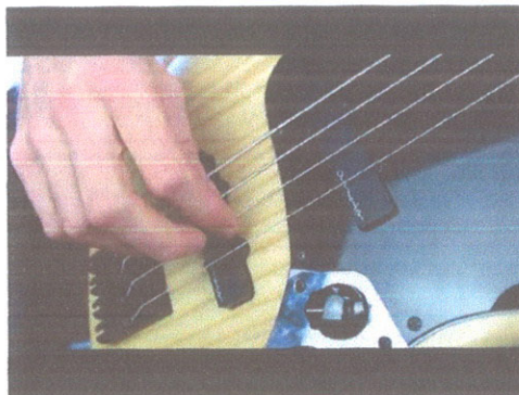
Posisi tangan jari untuk teknik Plucking Jaco pastorius