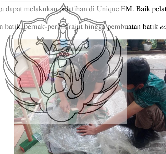
Gambar 1: Siswa membuat batik ecoprint

satu SLB di Kota Batu yang mendorong siswa difabel untuk punya kompetensi dan inovasi melalui UMKM Unique EM. Tercetus di tahun 2015, produk bermula dari pembuatan batik tulis dan cap hingga pernik-pernik, seiring dengan perkembangannya merambah untuk pembuatan batik ecoprint , lalu tas ecoprint , hingga dompet ecoprint . Selain Unique EM sebagai wadah siswa difabel untuk berkreasi dan berinovasi, masyarakat umum juga dapat melakukan pelatihan di Unique EM. Baik pelatihan untuk pembuatan batik, pernik-pernik rajut hingga pembuatan batik ecoprint .