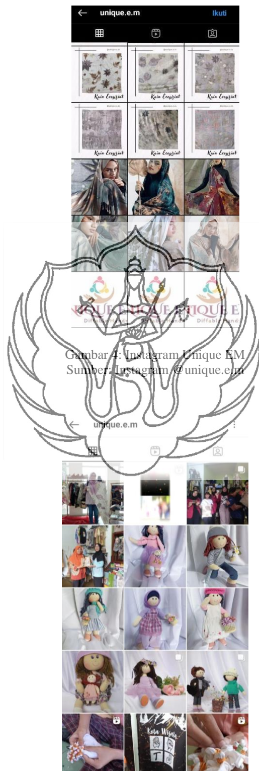
Gambar 4: Instagram Unique EM