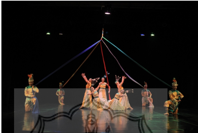
Gambar 7 : Adegan ending dengan seting dan properti berupa lima helai kain yang turun dari para-para, digunakan untuk menari dan membentuk sebuah anyaman tali

maka dari itu penata memilih warna biru tua untuk mengganti warna hitam pada seting dan properti dalam karya ini.