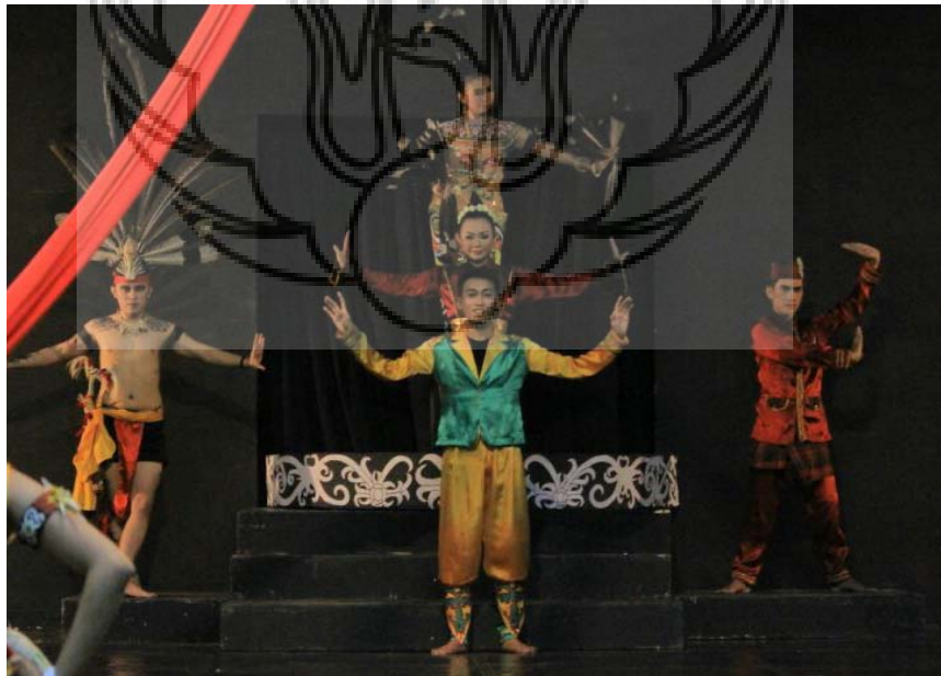
Gambar 8. Seting panggung pada adegan ending berupa tumpukan trap atau level . Trap paling atas berbentuk setengah lingkaran dengan hiasan ornamen ukiran Dayak.