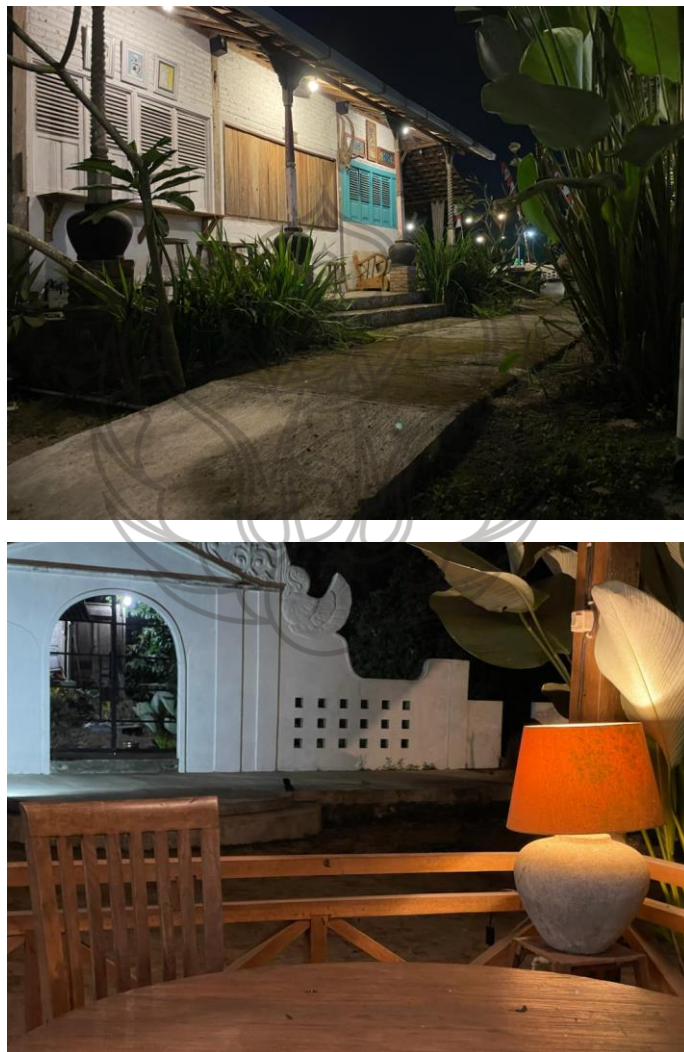
Gambar 1.1 Nuansa Rumah Makan Pawone Maklu.

disajikan. Pawone Maklu menyajikan konsep bangunan kuno dengan interior unik dan ayam kampung sebagai andalan utamanya. Pawone Maklu menawarkan interior seperti pemandangan bangunan benteng Yogyakarta kuno, hiasan lampu dari gerabah yang mengusung konsep unik, serta ukiran tiang kayu jati tradisional dengan gaya klasik menambah nilai estetika dan suasana hangat.