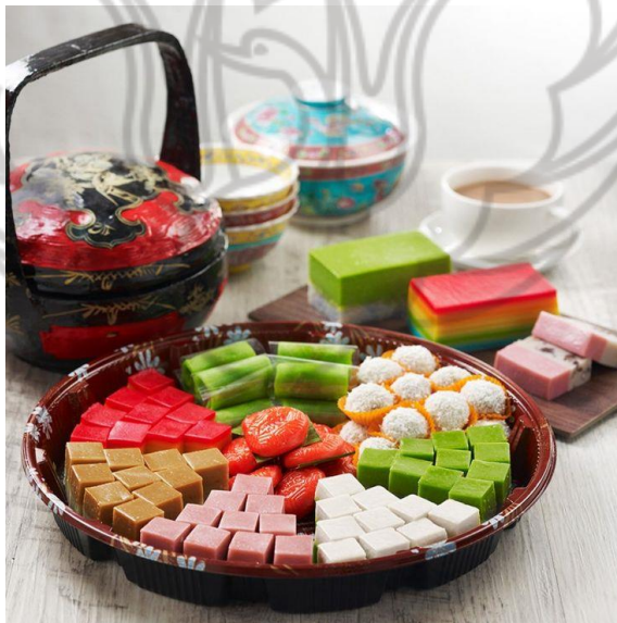
Gambar 1.2 Foto Produk Jajanan Pasar

Sebuah foto iklan harus mampu memberikan kesan kejutan dan keinginan untuk bereksperimen di setiap konsep visual yang akan dibuat. Iklan yang ditampilkan harus terlihat mencolok, menawan, dan artistik yang begitu memuaskan untuk melengkapi nilai-nilai seni. Fotografer harus memiliki banyak ide kreatif dan mempunyai keahlian dalam menciptakan visual supaya hasilnya lebih menarik perhatian masyarakat. Tidak sekedar untuk menarik perhatian saja, tetapi bagaimana caranya iklan tersebut menimbulkan rasa keinginan untuk membeli produk yang dipromosikan. Dengan adanya sebuah promosi dalam bentuk foto juga membuat konsumen mudah memilih produk dan menjadi lebih percaya diri untuk membelinya.