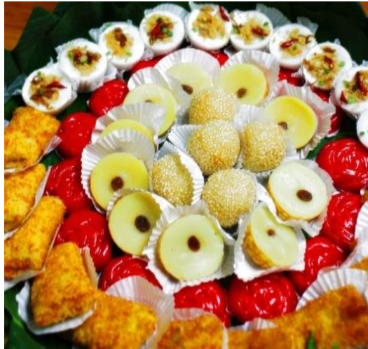
Gambar 1.1 Jajanan Pasar Tradisional