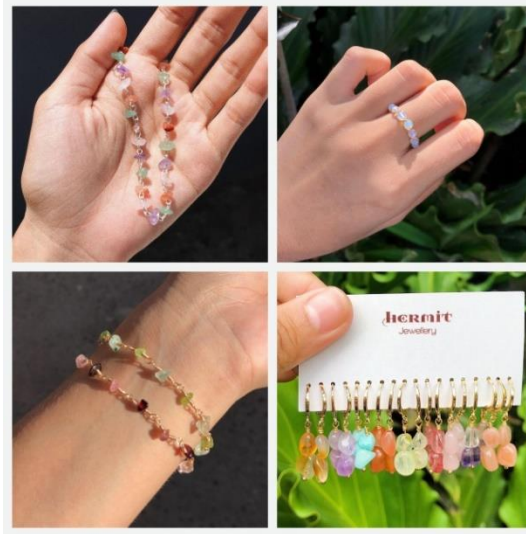
Gambar 1. Contoh foto brand Hermit Jewellery