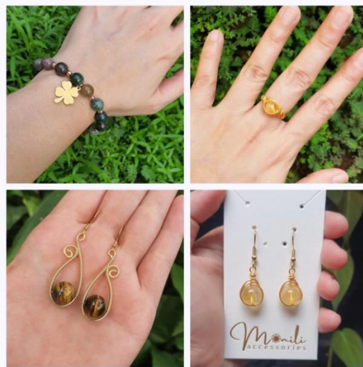
Gambar 2. Contoh foto produk brand Monili

Secara garis besar kedua perbandingan foto produk milik brand Hermit Jewellery dengan Monili Accessories diatas bisa dikatakan mirip. Beberapa aspek seperti pencahayaan alami yang masih tampak flat, foto yang kurang terkonsep, komposisi yang tidak terlalu diperhatikan, serta