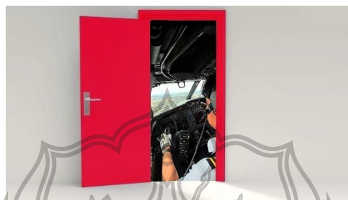
Gambar 5.4 gambar dengan makna konotasi sebagai penyampai keresahan

Selama proses produksi film dokumenter “Warna Lain”, tidak ditemukan kesulitan atau hambatan besar yang mempengaruhi secara signifikan. Semua dilakukan berdasarkan rancangan konsep praproduksi yang direncanakan dengan matang sebelumnya. Oleh sebab itu, penting bagi sutradara untuk membuat konsep praproduksi dengan rinci dan terencana. Adapun kendala kecil yang ditemukan saat proses produksi, yaitu kesulitan dalam mencari narasumber yang bersedia untuk diwawancara dan ditampilkan dalam film. Alasan dari ketidakediaan narasumber untuk ditampilkan karena merasa khawatir apabila dikemudian hari kelainan buta warna yang dianggap narasumber sebagai aib menjadi terpublikasi, sehingga narasumber merasa takut jika mendapat komentar negatif ataupun berujung pada hancurnya rencana karir narasumber. Namun kendala tersebut dapat teratasi dengan solusi mengaburkan informasi dari wajah identitas narasumber.