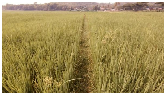
Gambar 5.2 penggunaan sudut kamera subjektif