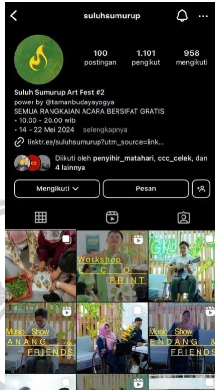
Gambar 4. 1 Akun Instagram Suluh Sumurup