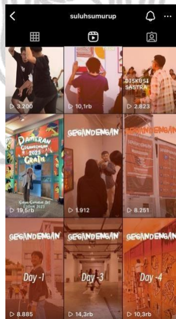
Gambar 4. 2 Reels Instagram Suluh Sumurup