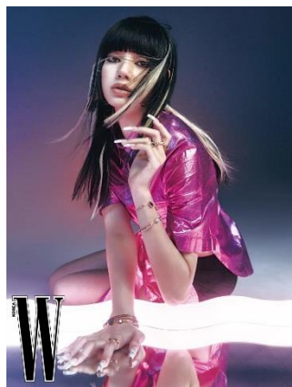
Gambar 1.3 Lisa Blackpink untuk W Magazine hasil foto Kim Heejune

Sumber: https://www.elle.com/culture/movies-tv/news/a15506/liv-tyler-fashion-empire-records/ diakses 6 Oktober 2023 pada pukul 20:17 WIB