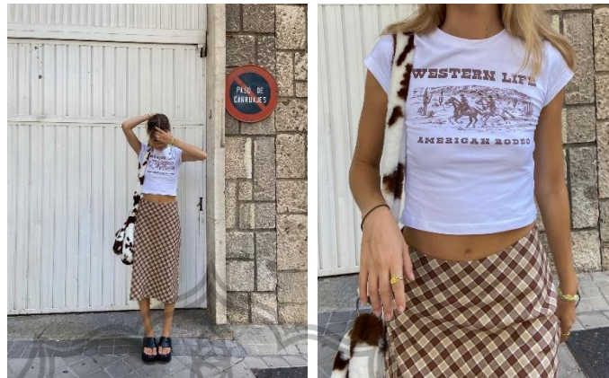
Gambar 1.1 Y2K 2022 Era

sebagai tren busana peralihan dari gaya Retro menuju style Futuris (Firescholars & Callery, 2023; Yang, 2023). Karakteristik ini yang dapat dijadikan pedoman padu padan pakaian untuk kegiatan sehari-hari.