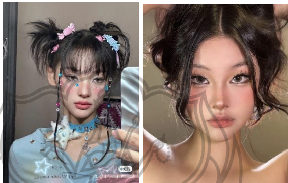
Gambar 1.5 Make Up Look and Hairstyle Inspiration

difokuskan tren gaya busana Y2K dengan mengkombinasikan pakaian pribadi yang dimiliki dan sentuhan aksesoris berwarna perak dapat terlihat sebagai busana Y2K dengan persona penggunanya melalui fotografi fashion yang sesuai dengan tren yang berkembang. Maka dari itu penggunaan make-up dan aksesoris detail sangat diperhatikan dalam penciptaan karya tugas akhir ini agar sesuai dengan konsep Y2K.