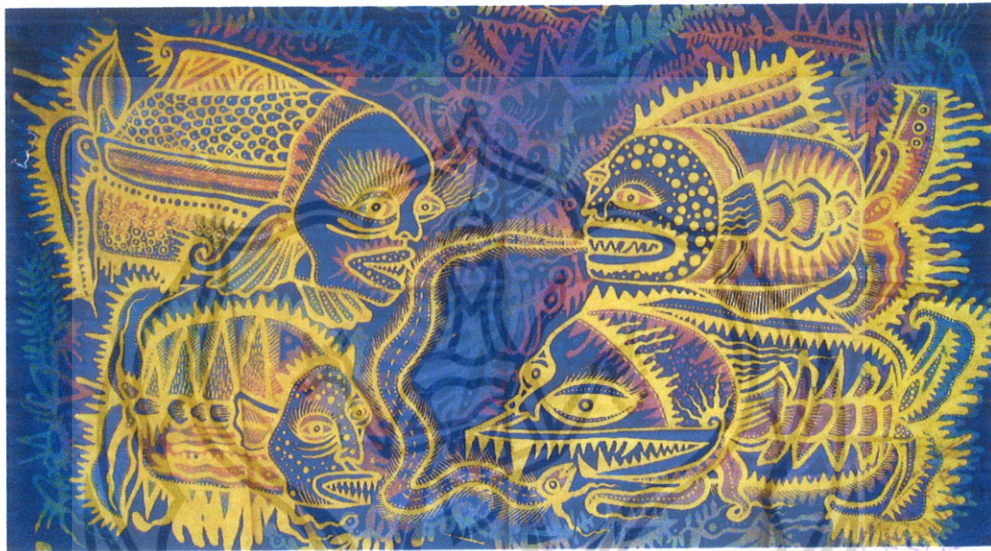
Gambar 35 Foto Karya 6

pengerjaannya menggunakan teknik celup. Selanjutnya finishing karya ini adalah pemasangan karya ke dalam pigura.