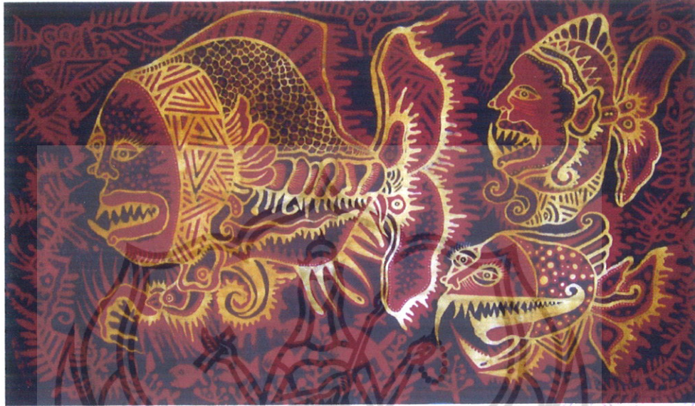
Gambar 31 Foto Karya 2

Judul Karya : Keluarga Ikan Piranha II Bahan Utama : Birkolin Ukuran : 50 x 90 cm Teknik : Batik tulis Warna : Naphol Tahun : 2009