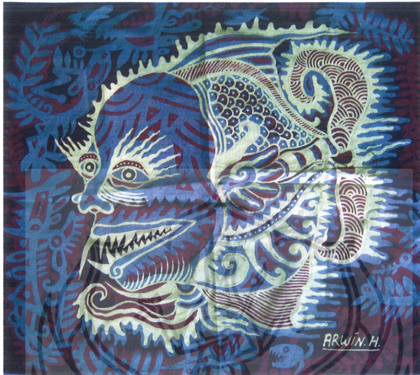
Gambar 37 Foto Karya 8