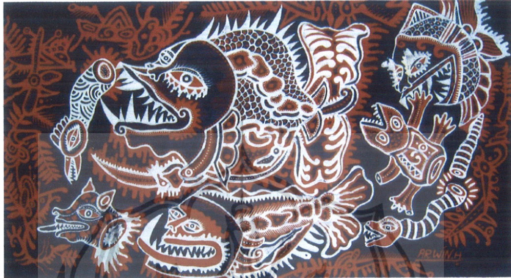
Gambar 32 Foto Karya 3

Judul Karya : Memangsa Bahan Utama : Birkolin Ukuran : 50 x 90 cm Teknik : Batik tulis Warna : Naphol Tahun : 2009