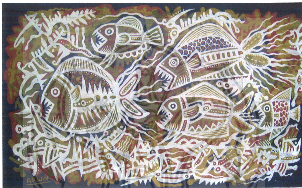
Gambar 34 Foto Karya 5

Tinjauan dari karya ini adalah bentuk dari Ikan Piranha yang sedang bergerombol mencari mangsa. Dalam karya ini ditonjolkan satu Ikan Piranha terbesar dari yang lain, disimbolkan sebagai pemimpin kelompok. Selanjutnya finishing karya ini adalah pemasangan karya ke dalam pigura.