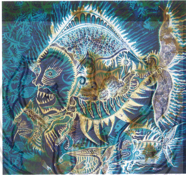
Gambar 33 Foto Karya 4

Judul Karya : Pemangsa Rawa Bahan Utama : Birkolin Ukuran : 90 x 90 cm Teknik : Batik tulis Warna : Naphol dan Indigosol Tahun : 2009