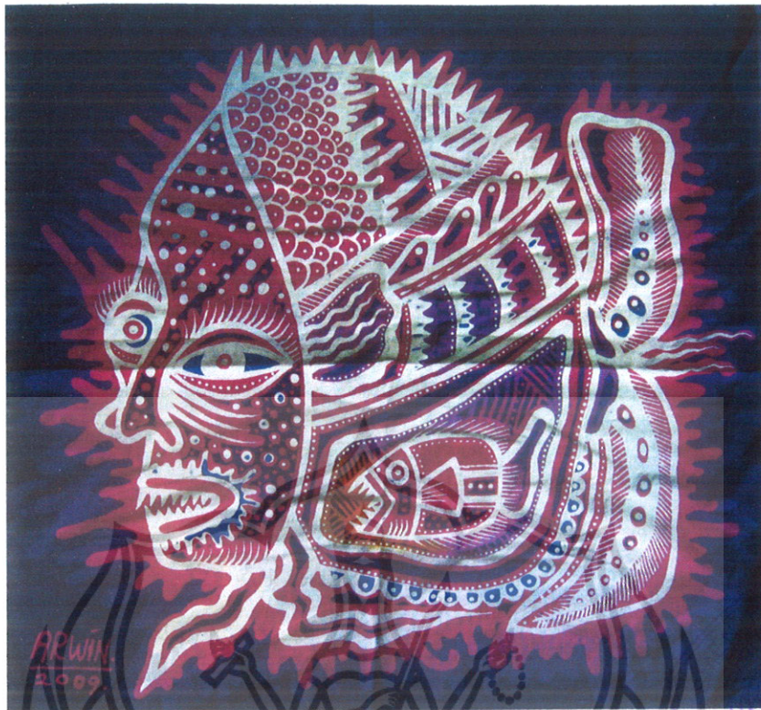
Gambar 37 Foto Karya 8