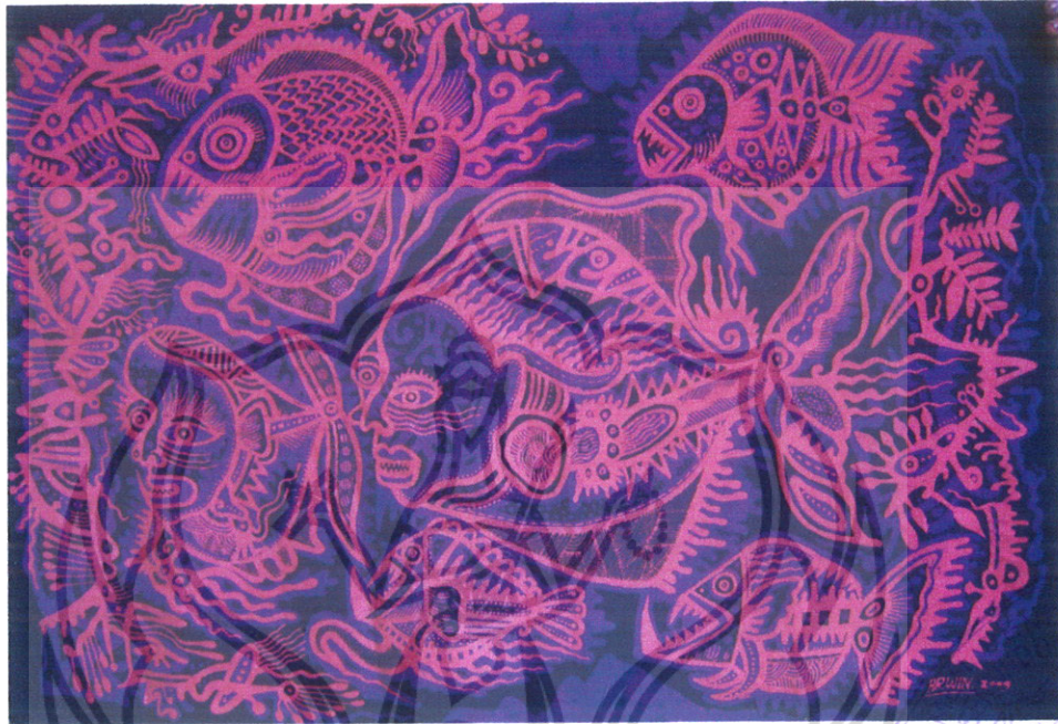
Gambar 36 Foto Karya 7

usap dan celup. Selanjutnya finishing karya ini adalah pemasangan karya ke dalam pigura.