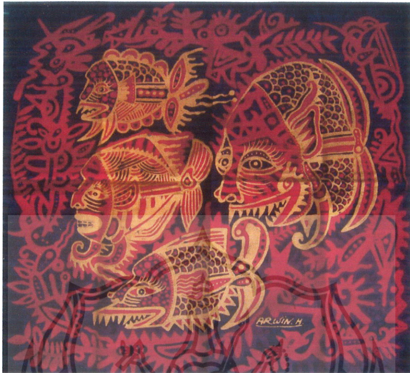
Gambar 30 Foto Karya 1