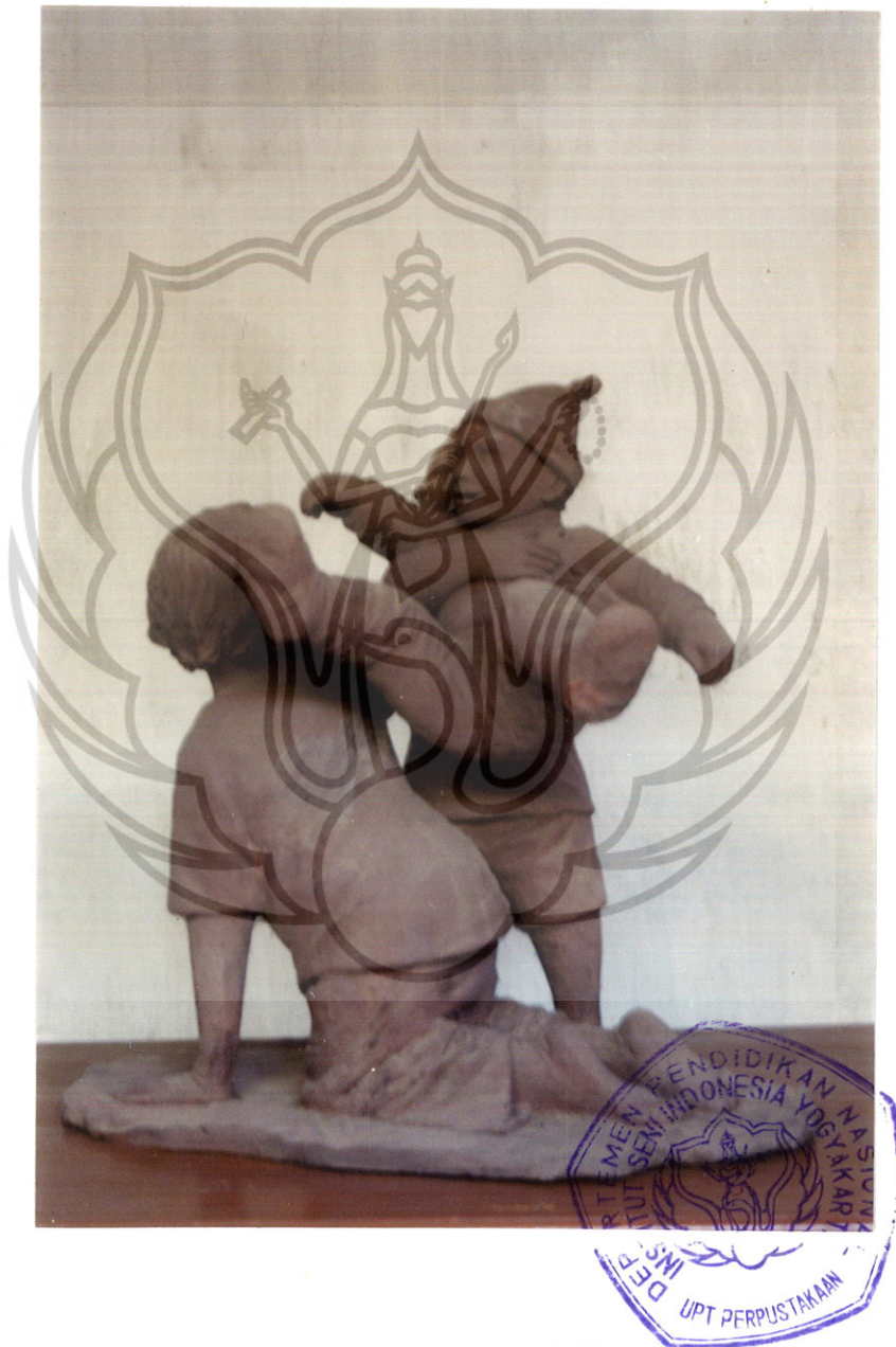
7. KUDA-KUDAAN P : 48 cm, L : 36 cm, T : 56 cm Gerabah