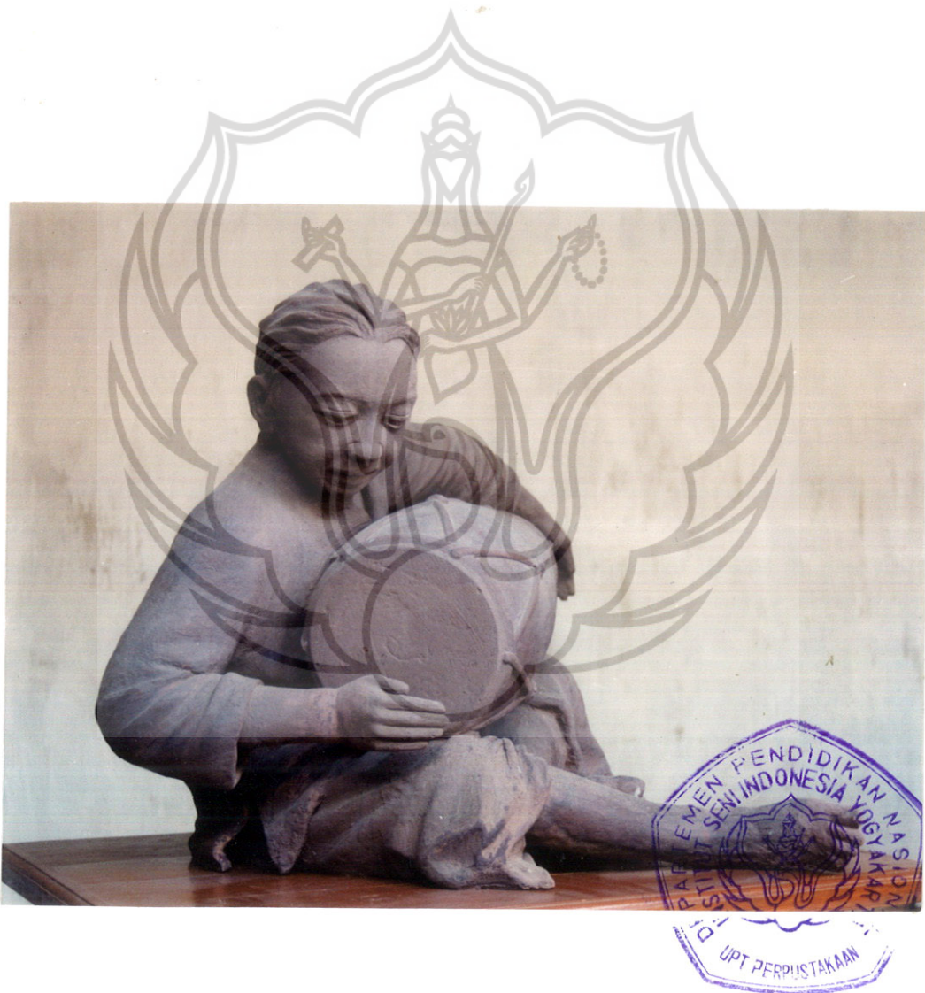
4. MAIN KENDANG P : 60 cm, L : 62 cm, T : 50 cm Gerabah