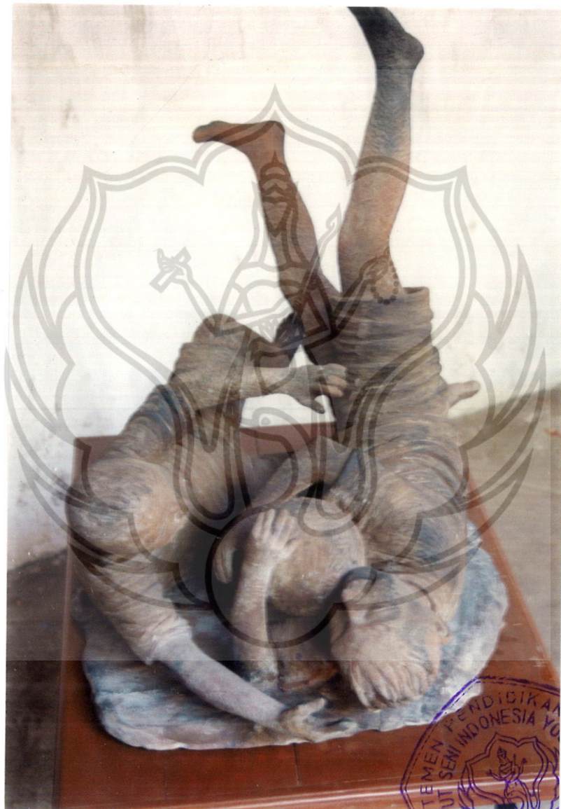
11. BEREPUT BOLA P : 65 cm, L : 45 cm, T : 84 cm Gerabah