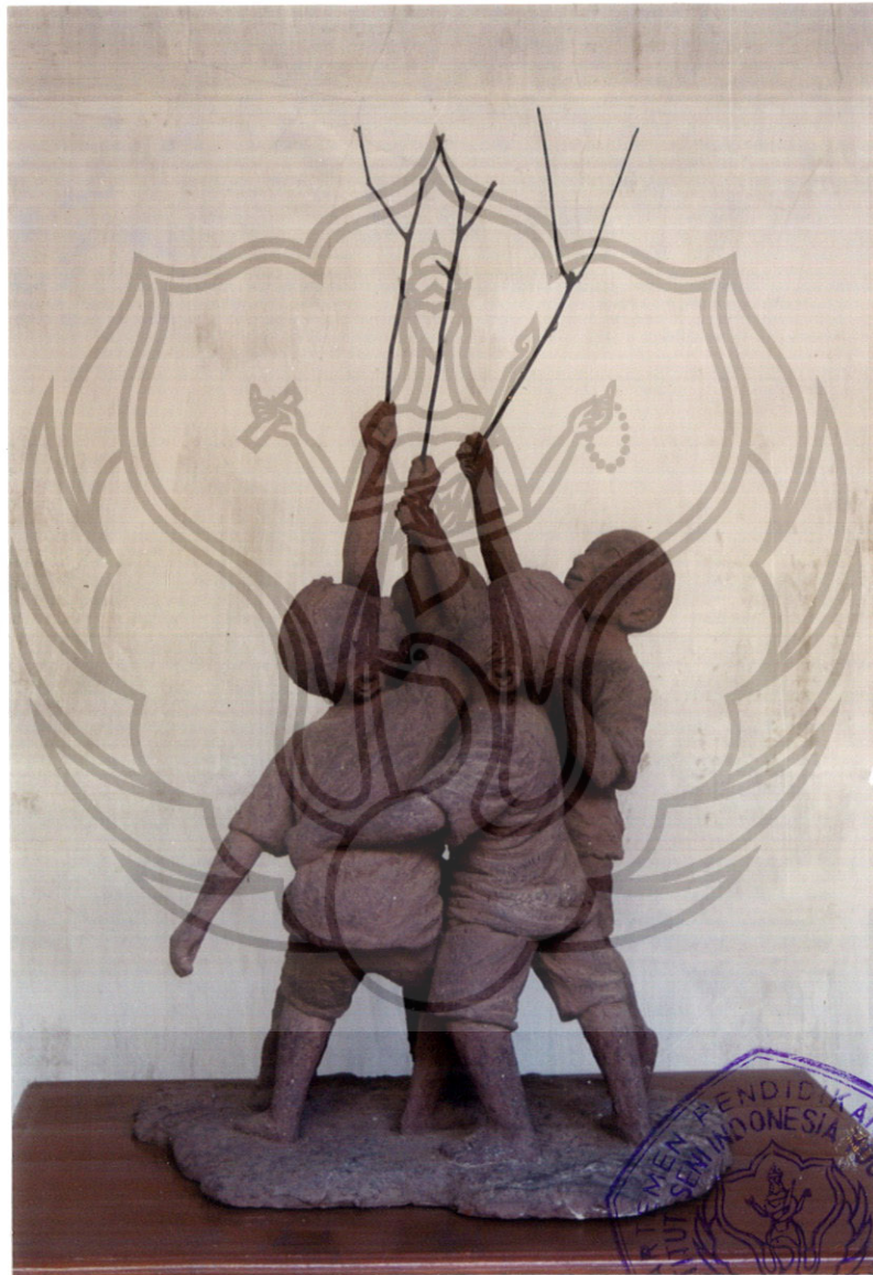
3. MENGGAPAI P : 47 cm, L : 37 cm, T : 80 cm Gerabah, Ranting