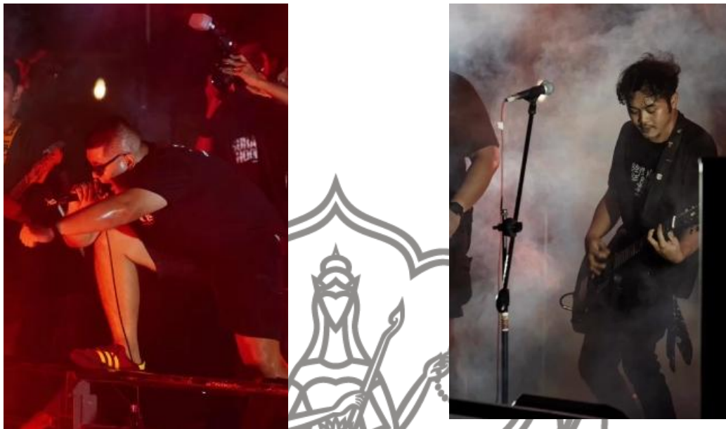
Gambar 1. 1 Karya: Edo Panji Tahun: 2023