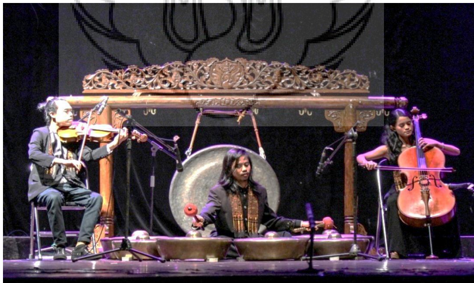
Gambar 2. Pementasan komposisi “Mrayung”