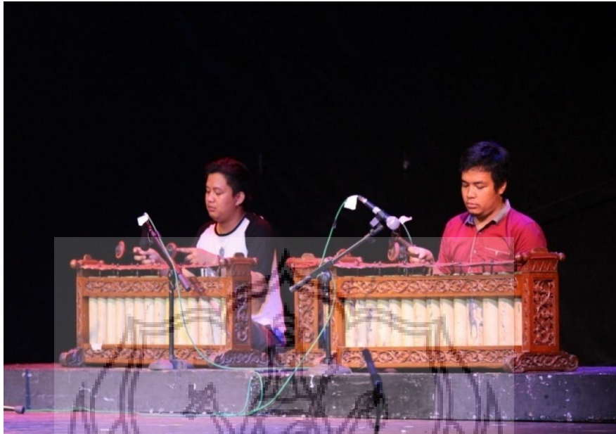
Gambar 3. Gladhi Bersih di Taman Budaya Yogyakarta