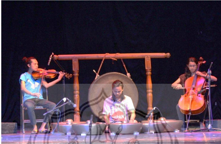
Gambar 1. Gladhi Bersih di Taman Budaya Yogyakarta