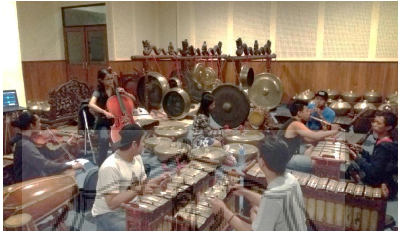
Gambar 1. Proses latihan di Ruang Gamelan Goplo jurusan Karawitan FSP ISI Yogyakarta