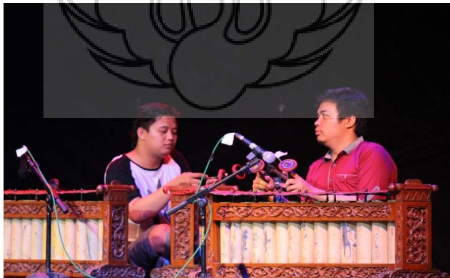
Gambar 4. Gladhi Bersih di Taman Budaya Yogyakarta