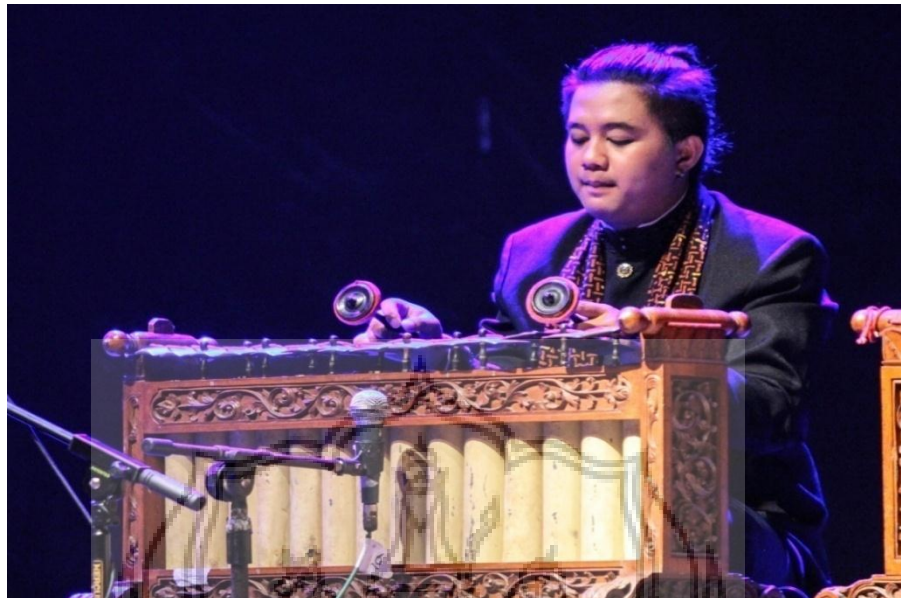
Gambar 3. Pementasan komposisi “ Mrayung ”