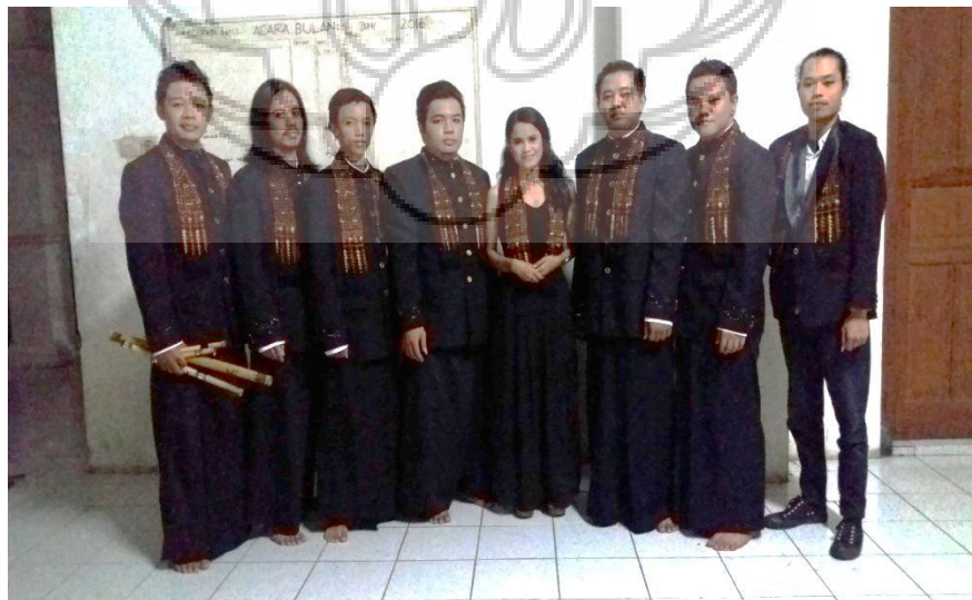
Gambar 6. Pemain “ Mrayung ”