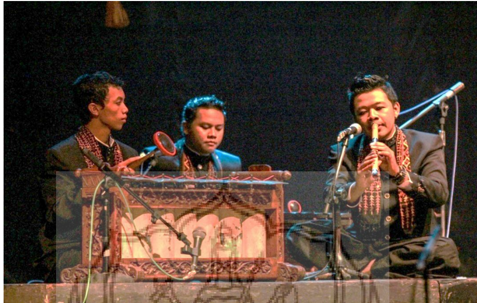
Gambar 1. Pementasan komposisi “Mrayung”