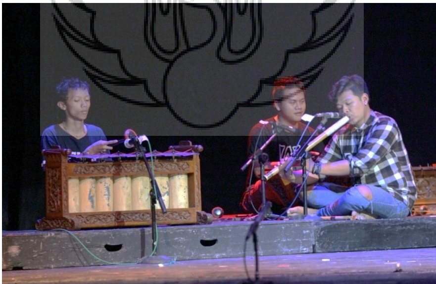
Gambar 2. Gladhi Bersih di Taman Budaya Yogyakarta