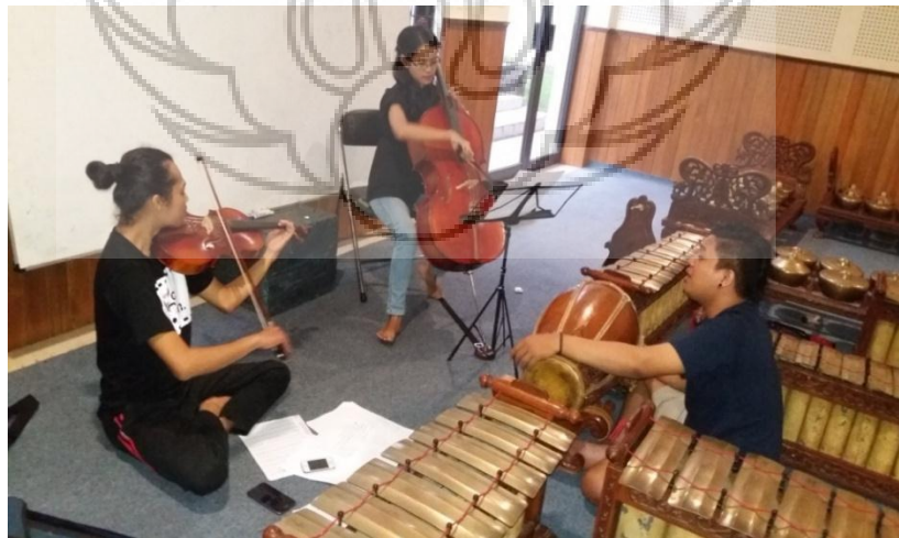
Gambar 2. Proses latihan di Ruang Gamelan Goplo jurusan Karawitan FSP ISI Yogyakarta