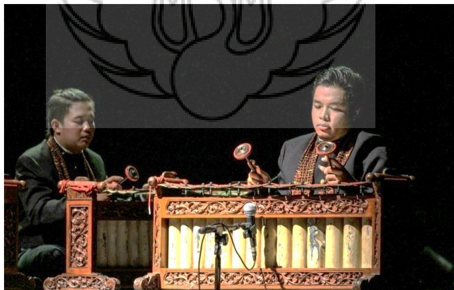
Gambar 4. Pementasan komposisi “ Mrayung ”