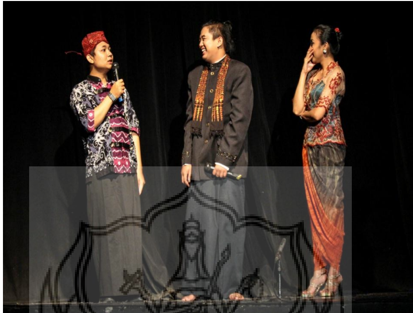
Gambar 5. Mc dan komposer “ Mrayung ”