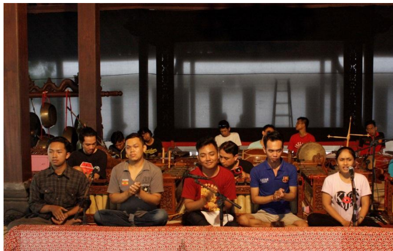
Gambar 5. Penyaji Saat Gladi Bersih (GR)