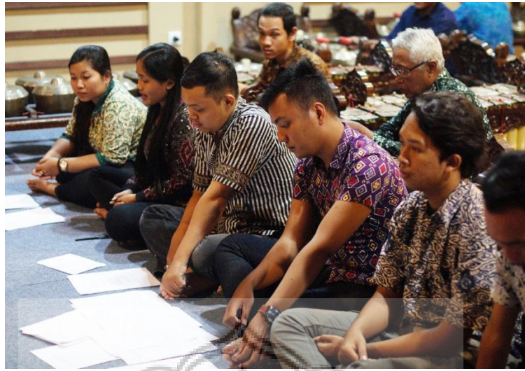
Gambar 3. Penyaji Saat Ujian Kelayakan