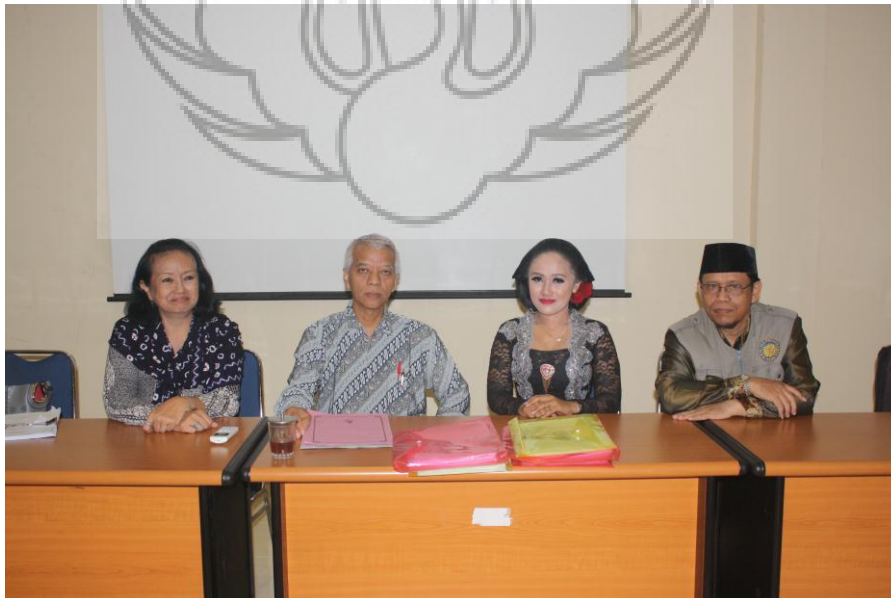
Gambar 11. Penyaji dengan Tim Penguji Setelah Pendadaran