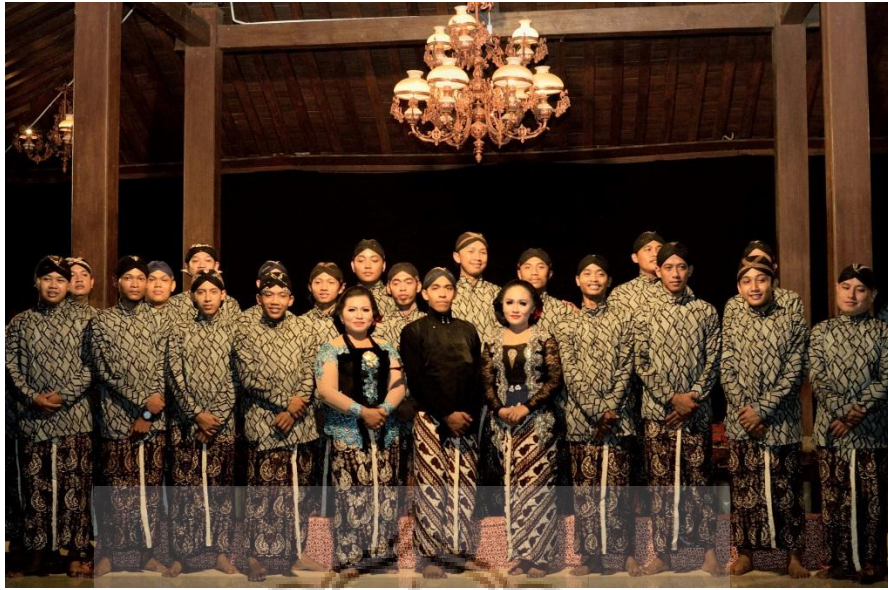
Gambar 10. Setelah Penyajian Selesai