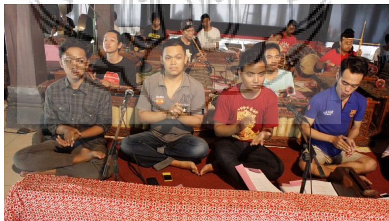
Gambar 6. Pendukung Saat Gladi Bersih (GR)