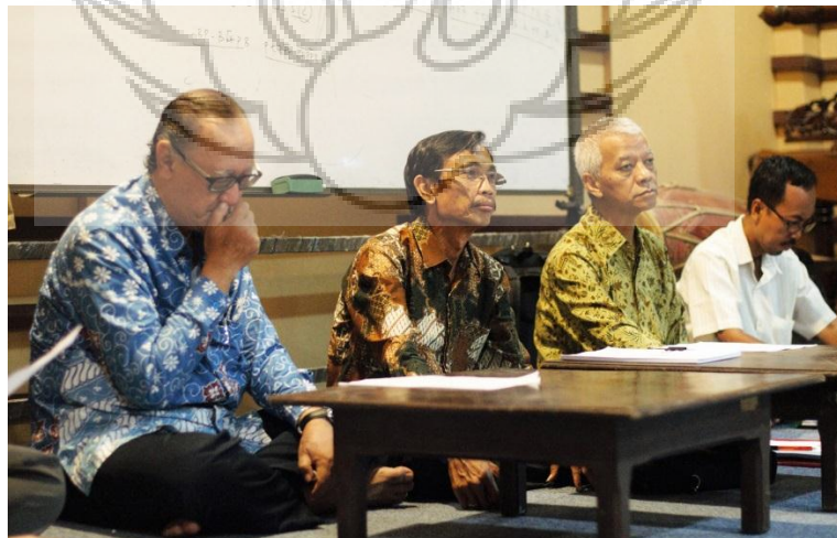
Gambar 4. Tim Penguji Mengamati Penyajian Gendhing saat Ujian Kelayakan Berlangsung