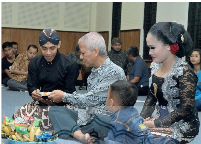
Gambar 7. Penyaji Pada Saat Tumpengan Sebelum Penyajian Dimulai