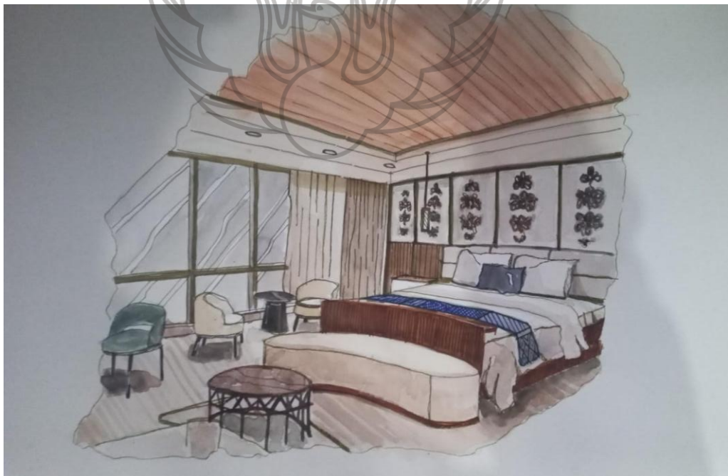
Gambar 6.4 Perspektif Manual Bedroom