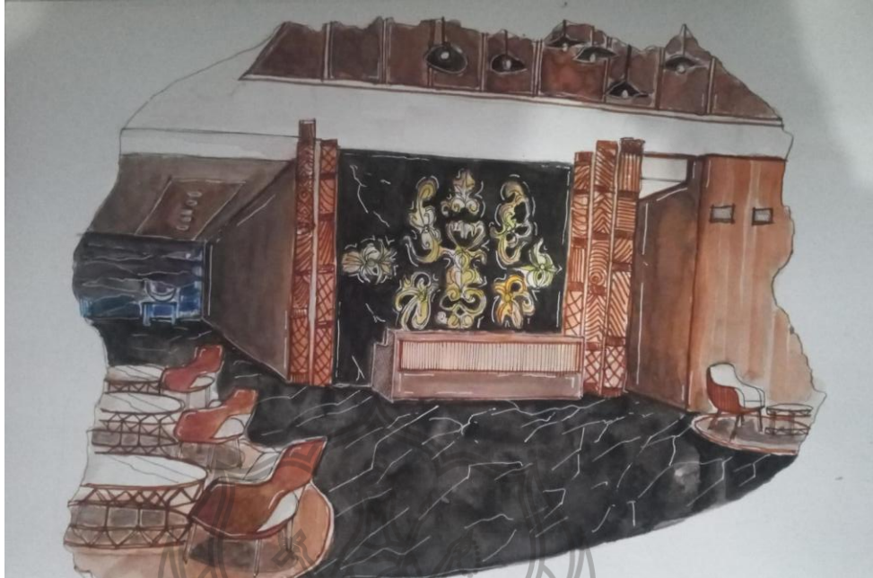
Gambar 6.1 Perspektif Manual Lobby