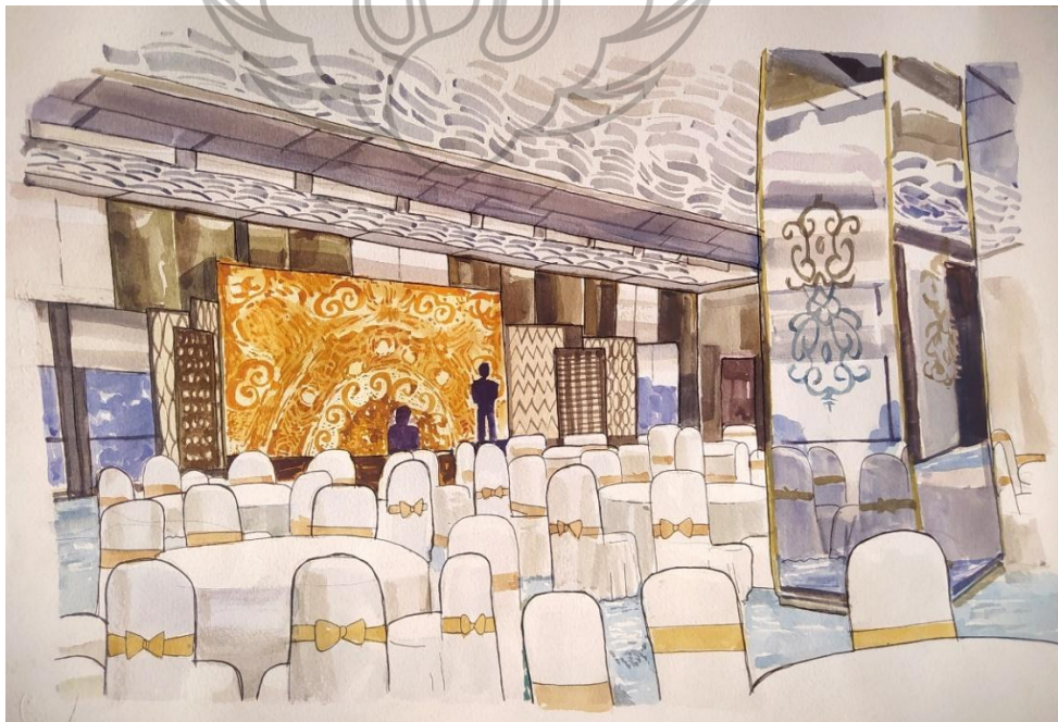
Gambar 6.2 Perspektif Manual Ballroom