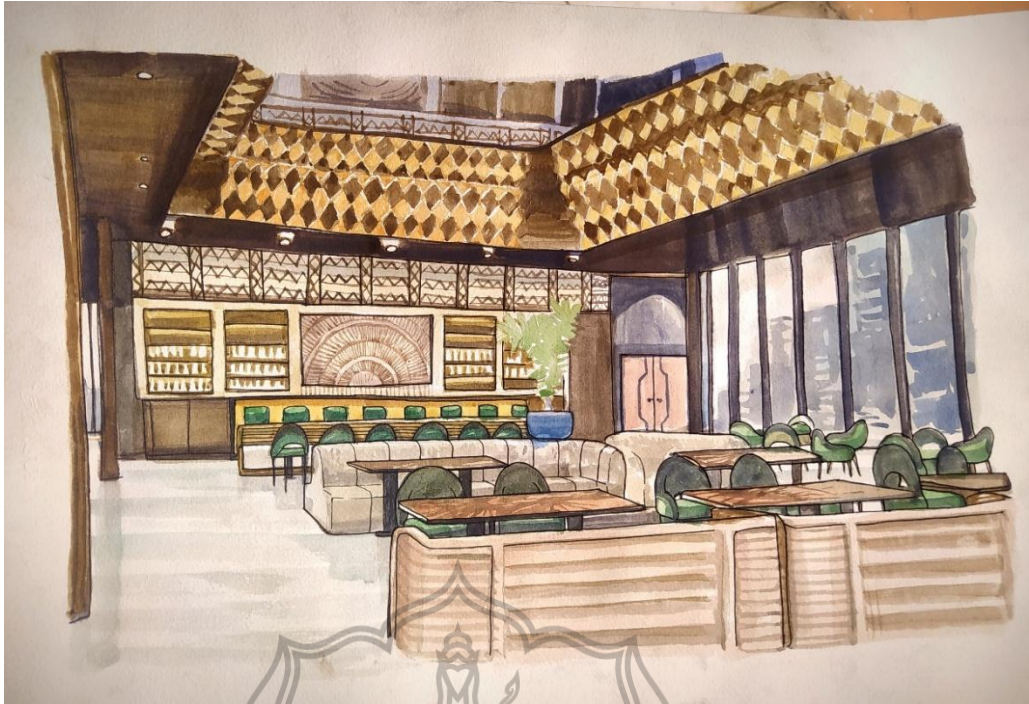
Gambar 6.3 Perspektif Manual All Day Dining