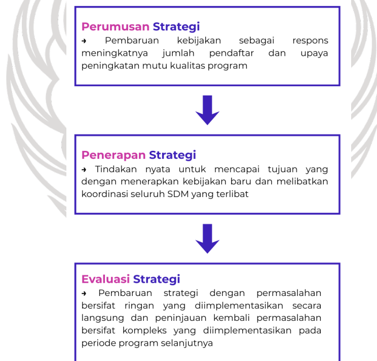
Gambar 4. 2. Manajemen Strategi Pada AFC TBY Tahun 2025

pembagian tugas pada para pengajar berdasarkan kompetensi masing-masing merupakan langkah strategis yang bertujuan untuk mengoptimalkan potensi individu dalam menunjang kelancaran pelaksanaan program. Pendekatan ini tidak hanya meningkatkan efektivitas penyampaian materi pembelajaran, namun juga memperkuat koordinasi antar pengajar sehingga kegiatan dapat dilaksanakan secara efisien. Fleksibilitas dalam struktur organisasi yang dikombinasikan dengan pembagian tugas yang sesuai dengan kompetensi para pengajar memungkinkan AFC TBY untuk tetap responsif terhadap perubahan kebutuhan peserta dan kondisi lapangan. Selain itu, mekanisme ini mendukung terciptanya lingkungan kerja yang kondusif, dimana setiap pengajar dapat mengembangkan kemampuan profesionalnya sekaligus memastikan kualitas interaksi belajar yang optimal bagi peserta didik dalam sebuah ruang pendidikan nonformal seni.