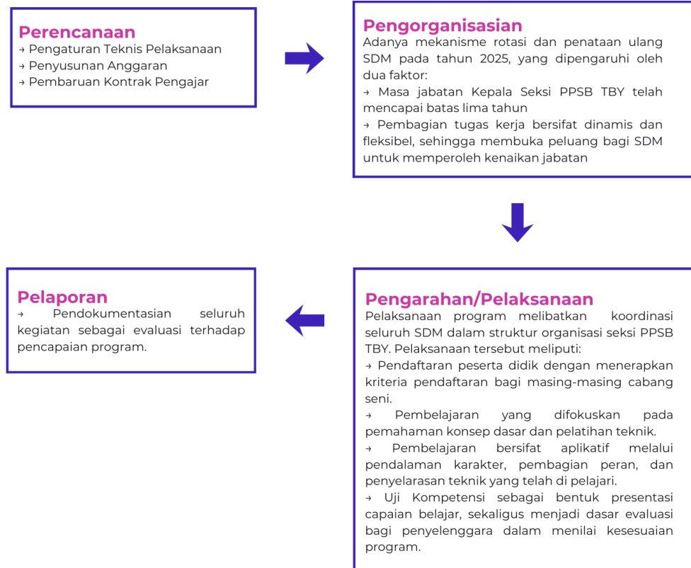
Gambar 4. 1. Skema Alur Pelaksanaan Program AFC TBY Tahun 2025

Pelaksanaan program AFC TBY di Taman Budaya Yogyakarta menunjukkan penerapan fungsi manajemen yang sistematis sebagai landasan utama keberlangsungan program. Sejalan dengan tujuan program untuk menyediakan ruang edukasi yang mengintegrasikan proses belajar dan bermain secara menyenangkan, pelaksanaan AFC TBY menitikberatkan pada pengalaman belajar bersifat interaktif dengan melibatkan interaksi aktif antara pengajar dan peserta didik. Melalui tahapan fungsi manajemen PODR yang meliputi planning , organizing , directing/actuating , dan reporting , AFC TBY berhasil menciptakan program melalui pendidikan nonformal seni yang inklusif dan berkelanjutan.