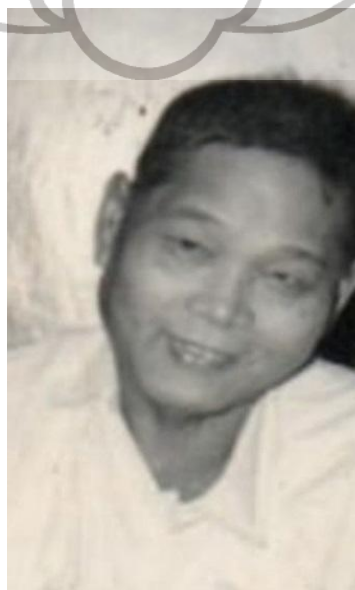
Gambar 1.1 Potret Nahum Situmorang

Nahum Situmorang (1908–1969) adalah salah satu legenda musik Batak yang mewakili semangat tersebut. Dia lahir di Sipirok, Tapanuli Selatan, mengasah kemampuan musiknya sejak pendidikan di