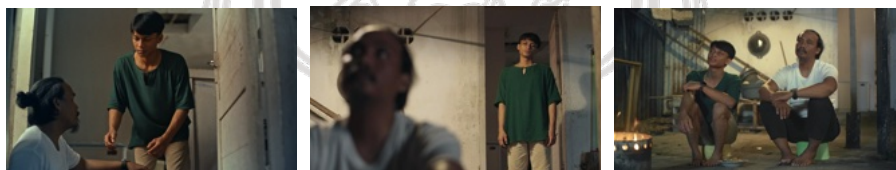
Gambar 5.2 Efek perspektif menekankan hubungan mendekat

Setiap focal length telah menekankan dinamika hubungan tokoh utama, lensa 20mm yang memberikan kesan perluasan yang membentuk jarak, subjek yang dijauhkan, dan distorsi, terhadap hubungan yang sedang berjarak.