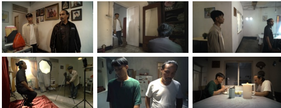
Gambar 5.1 Efek perspektif menekankan hubungan berjarak