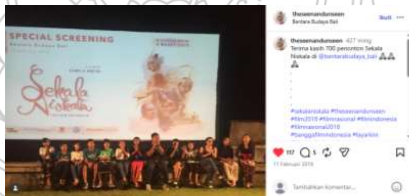
Gambar 1. 1 Dokumentasi Special Screening Film Sekala Niskala .

Dalam pencapaiannya, film ini telah meraih berbagai pengakuan internasional pada tahun 2017, diantaranya Toronto International Film Festival; Asia Pacific Screen Award; Tokyo FILMeX; dan JAFF. Selain itu, film ini juga menggelar special screening dengan 700 penonton di Bentara Budaya Bali sebelum resmi rilis di bioskop Indonesia pada 8 Maret 2018.