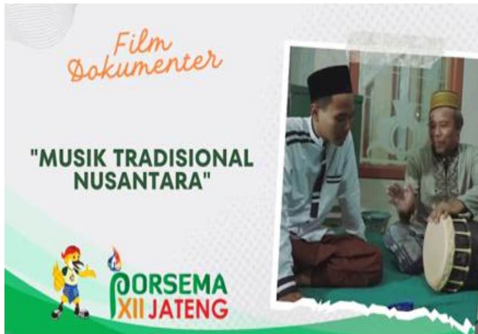
Gambar 1. 1. Film dokumenter karya Skanu Film "Dokumenter dari Tegal"

Film kedua yang menjadi referensi adalah film dengan judul " Smong " ciptaan Pesona Indonesia. Smong yang berarti gelombang besar atau Tsunami dalam bahasa Simeulue merupakan cerita bagaimana Gempa dan tanda-tanda Tsunami diceritakan secara turun temurun yang disebut Nafi-nafi dan syair-syair yang disebut Nandong dalam bahasa Simalungun. Syair-syair yang dibuat mengandung edukasi tentang kebencanaan yang dapat dipahami dari generasi ke generasi. Film ini memberikan pengaruh terhadap gaya visual dan narasi dalam Film Soyar Maole, dimana mengangkat isu bencana alam.