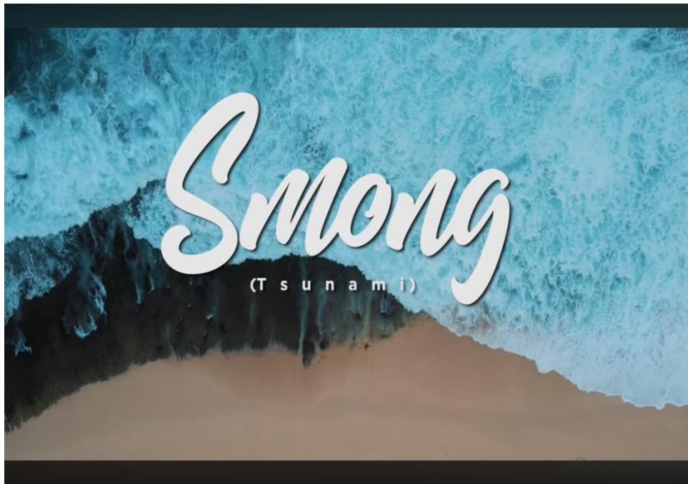
Gambar 1. 2. Film karya Pesona Indonesia "Smong Tsunami"

Karya dokumenter Soyar Maole dengan judul "Agar Tak Padam" juga terinspirasi dari Musik Video (MV) karya Prawiratama Indonesia dengan judul " Donga Dinonga " pada karya ini berisikan doa-doa lintas agama yang saling mendoakan dengan caranya masing-masing atas situasi saat ini, manusia dihadapkan pada situasi yang sangat berat antara bertahan atau melawan, bangkit atau menyerah. Instropeksi diri akan sifat-sifat manusia yang selalu iri dengki dan berbuat kerusakan di muka bumi. Dari karya " Donga Dinonga " inilah dokumenter Soyar Maole terinspirasi untuk mengangkat pembahasan tentang pelestarian tradisi dan pelestarian alam yang ada di wilayah Kaligesing. Seperti yang pernah diungkapkan oleh Emha Ainun Nadjib atau akrab disapa Cak Nun beliau mengungkapkan " Jawa digawa, Arab digarap. " yang memiliki makna pertama " Jawa digawa " mengisyaratkan bahwa hal itu adalah pengingat bagi orang Jawa