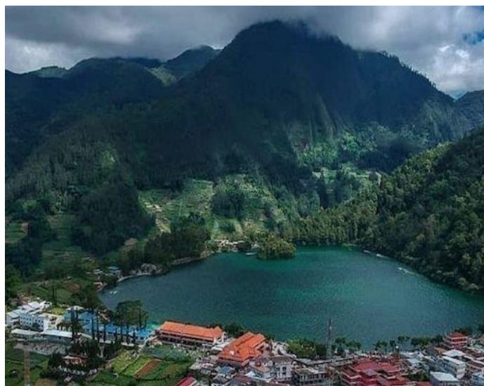
Gambar 1. Foto Telaga Sarangan.

menjadi tujuan utama destinasi wisata alam di Kabupaten Magetan. 1 Magetan adalah salah satu kabupaten yang berada di Provinsi Jawa Timur, Magetan dikenal dengan wilayahnya yang sejuk karena berada di kaki Gunung Lawu. Letaknya yang dekat dengan pegunungan membuat Kabupaten Magetan kaya dengan wisata alam, salah satunya adalah Telaga Sarangan. Berikut adalah foto Telaga Sarangan :