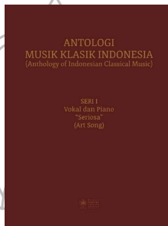
Gambar 1.1 Buku Antologi Musik Klasik Indonesia Seri I Vokal dan Piano "Seriosa" .

seperti ritme, harmoni, dan dinamika, meskipun keduanya hadir dalam medium yang berbeda, sehingga keduanya sama-sama mampu membentuk suasana dan emosi tertentu. Selain itu, disadari bahwa lagu seriosa tidak hanya hadir sebagai bunyi, tetapi juga memperlihatkan kualitas gerak melalui alur melodi dan ritme yang mengalir serta perubahan dinamika yang membentuk tekanan dan aksen. Pengalaman ini menimbulkan kesan visual yang seolah menyertai jalannya musik, sehingga membuka kemungkinan untuk menerjemahkan pengalaman auditori ke dalam bentuk visual.