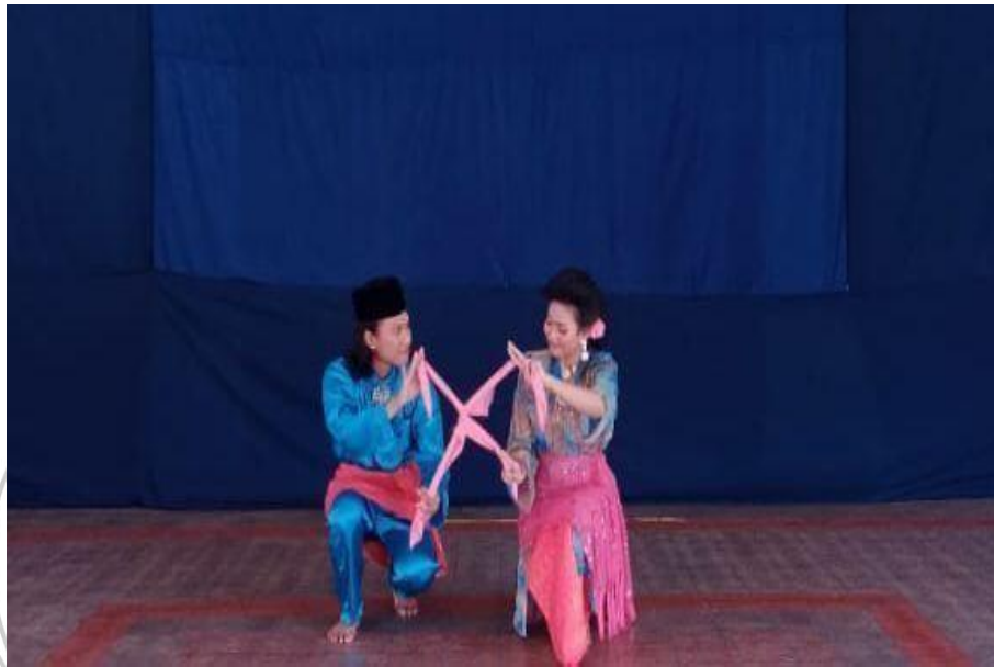
Gambar 1. Perlombaan tari serampang XII virtual TMII

yang sangat pakem dan tidak dapat diubah secara semena mena, dan menarikannya dengan cara yang sembarangan, Serampang XII ini juga memiliki teknik tarinya sendiri, agar dimana para penari dapat menarikannya dengan baik dan seksama