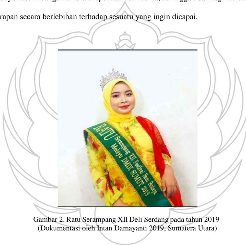
Gambar 2. Ratu Serampang XII Deli Serdang pada tahun 2019

mendalam ketika impian tidak tercapai, sehingga meninggalkan kesan emosional yang kuat. Pengalaman ini sempat membuat penata enggan kembali mengikuti perlombaan Tari Serampang XII karena rasa takut akan kekecewaan yang berulang. Seiring berjalannya waktu, penata mulai melakukan proses penerimaan dan penyadaran diri. Penata menyadari bahwa dalam mencapai sebuah tujuan perlu adanya keseimbangan antara ekspektasi dan realita, sehingga tidak lagi meletakkan harapan secara berlebihan terhadap sesuatu yang ingin dicapai.