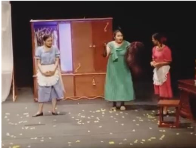
Gambar 1. Tokoh Solange, Nyonya, dan Claire dalam pementasan Ba-Bi & Ba-Bu oleh mahasiswa ISI Padangpanjang (2023)

Ba-Bi & Ba-Bu (2014) adaptasi Rachman Sabur, yang bersumber dari naskah Pelayan versi terjemahan Asrul Sani. Dalam adaptasi ini, Sabur menyesuaikan latar sosial dan penggunaan bahasa agar lebih sesuai dengan konteks masyarakat Indonesia, tanpa mengubah inti dramatik karya Jean Genet. Pementasan tersebut menekankan dinamika kuasa dan ketundukan manusia melalui simbol dan bahasa tubuh berakar lokal, sehingga menghadirkan bentuk pertunjukan eksperimental yang tetap setia pada semangat absurditas Genet.