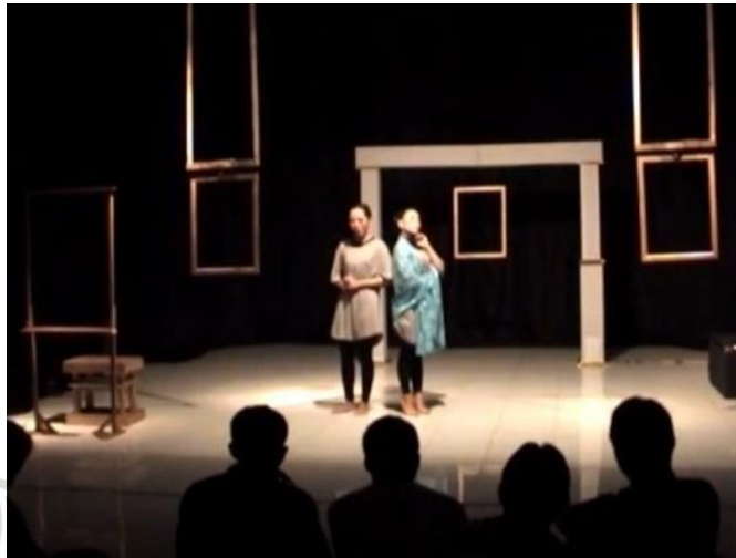
Gambar 3. Tokoh Solange dan Claire dalam pementasan Pelayan Menggugat (2014)

Pelayan Menggugat yang disutradarai Khoiri Abdillah dari Komunitas Seni Nawiji (2014), juga menjadi sumber acuan penting. Berdasarkan rekaman video yang diakses melalui YouTube, pementasan ini merupakan interpretasi atas naskah Les Bones karya Jean Genet. Tokoh Solange digarap dengan menitikberatkan pada bahasa tubuh dan minim penggunaan dialog. Pemeran mengeksplorasi gestur serta repetisi gerak untuk menyampaikan tekanan psikis dan bentuk perlawanan simbolik terhadap kekuasaan majikan. Walaupun kuat secara visual, fokus pementasan lebih tertuju pada dinamika dua pelayan secara bersama, sehingga pendalaman tokoh Solange sebagai individu tidak menjadi pusat perhatian.