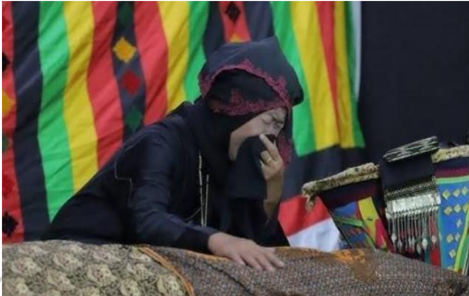
Gambar 1. Ritual Bailau foto Google Pertunjukan Seni Ilau KTK Solok Screenshot Silfa Wulandari

Kesedihan ini disampaikan dalam wujud “ maratok kamatian sipangka dek kamatian ” (meratap keluarga dikampung karena kematian), “ manangih maratok bailau ” (menangis, meratap sebagai ratapan kematian), akhirnya peristiwa ini dikenal dengan sebutan ilau atau bailau . Tradisi bailau ini dilaksanakan dengan tujuan untuk mengabarkan kepada masyarakat setempat atau di kampung bahwa salah seorang anak laki-laki mereka meninggal di perantauan. Kabar duka disampaikan kepihak bako (keluarga bapak) karena menurut adat kematian di Solok, kehadiran pihak bako memiliki peran penting dan arti yang penting dalam penyelenggaraan adat kematian.