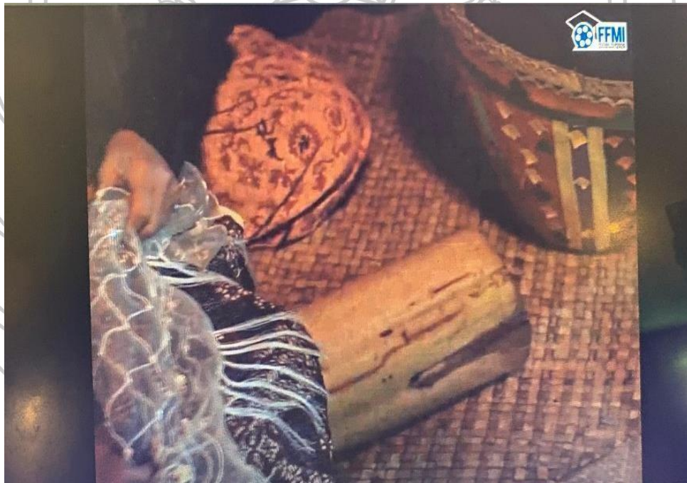
Gambar 2. Gambar Batang Pisang yang di tutupi Baju Besar dari Film Bujang Bailau

adat Solok. Baju ini digunakan untuk menutupi batang pisang yang di simbolkan sebagai mayat, sehingga batang pisang tersebut menyerupai jasad manusia yang tidur dengan menggunakan pakaian kebesaran. Di dekat batang pisang yang telah ditutupi baju kebesaran, para keluarga menghentak-hentakan kaki, menepuk-nepuk dada sambil merapat dengan menyebut-nyebut kebaikan almarhum serta harapannya terhadap anak yang telah meninggal dengan berjalan membentuk pola setengah lingkaran. Hal ini dilakukan tidak begitu lama sampai masuknya Islam di Minangkabau.