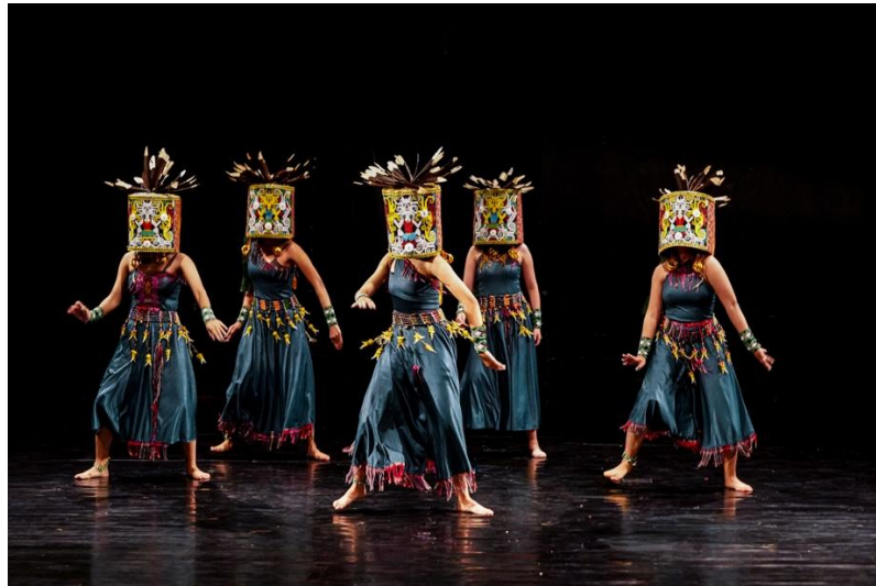
Gambar 2: Penampilan tari “Leto” pada Koreografi Mandiri III dengan penggunaan topeng Hudoq Aban .

disusun dari rangkaian manik tersebut biasanya terinspirasi dari bentuk alam, hewan, maupun pola geometris yang diwariskan secara turun-temurun. 5