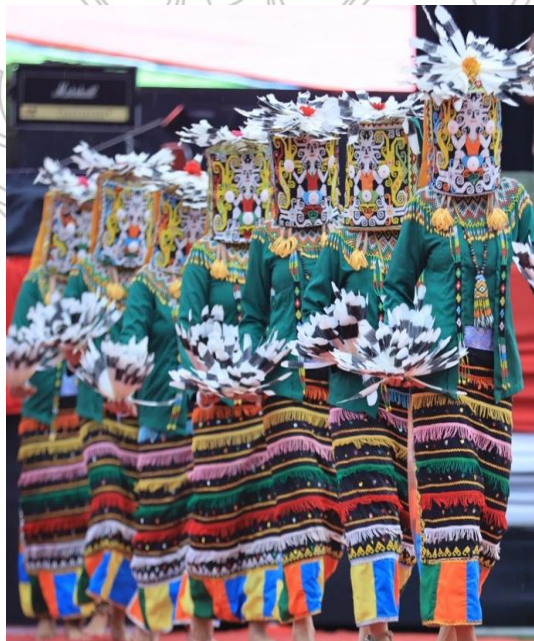
Gambar 1. Tari Hudoq Aban dalam perayaan Hari Tari Sedunia

Topeng ritual merupakan salah satu bentuk ekspresi budaya yang memiliki hubungan erat dengan sistem kepercayaan masyarakat tradisional. Dalam berbagai kebudayaan, topeng tidak hanya berfungsi sebagai elemen estetis dalam pertunjukan, tetapi juga memiliki makna simbolik dan spiritual yang berkaitan dengan hubungan manusia, alam, dan dunia roh. Pada masyarakat Dayak di Kalimantan Timur, khususnya Dayak Kenyah, salah satu bentuk topeng yang dikenal dalam tradisi masyarakat Dayak adalah Hudoq Aban , yaitu topeng ritual yang digunakan dalam konteks upacara yang berkaitan dengan siklus pertanian dan kesuburan. 1