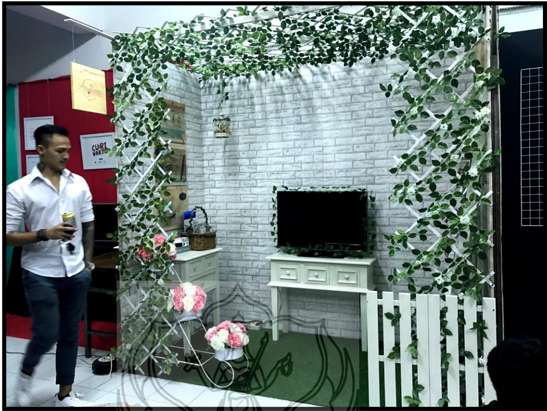
Foto pada saat pameran di Gallery Soetopo (Gedung DKV ISI Yogyakarta)